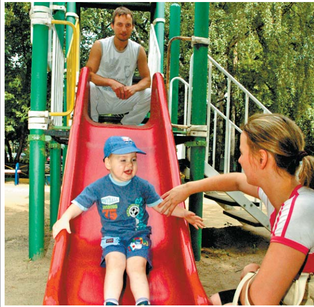
Янтарный, 11: эту площадку никто не тронет