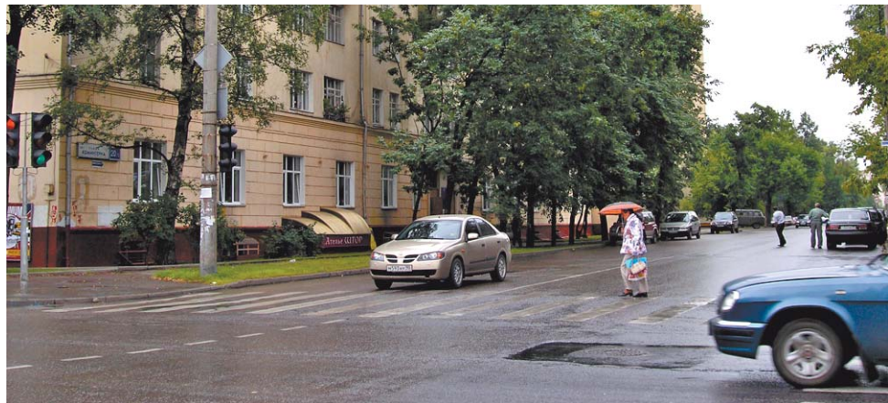
На этом перекрестке у кинотеатра «Аврора» ДТП происходят наиболее часто