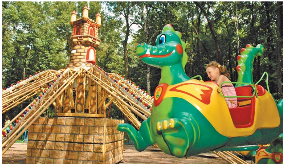
В парке есть аттракционы на любой вкус и возраст