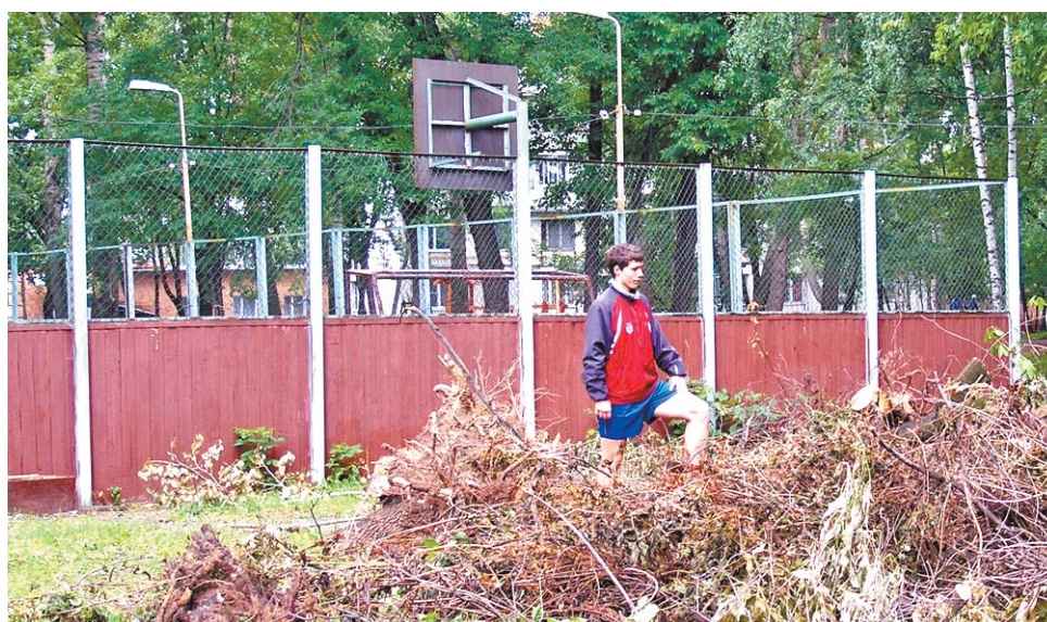
Площадку на Тайнинской, 26, обещают возродить к жизни к 5 августа

Результат этой программы — уже практически «реанимированная» спортплощад-