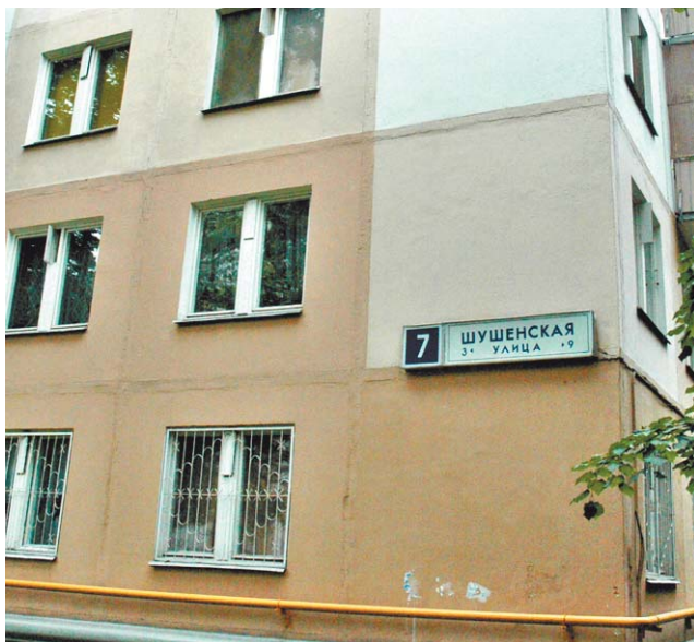
На месте этого дома вырастет новостройка, в которой откроется молодежный клуб

— Когда планируется строительство и снос домов в микрорайоне?