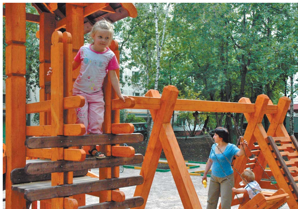
На Тайнинской, 22, детворе теперь привольно