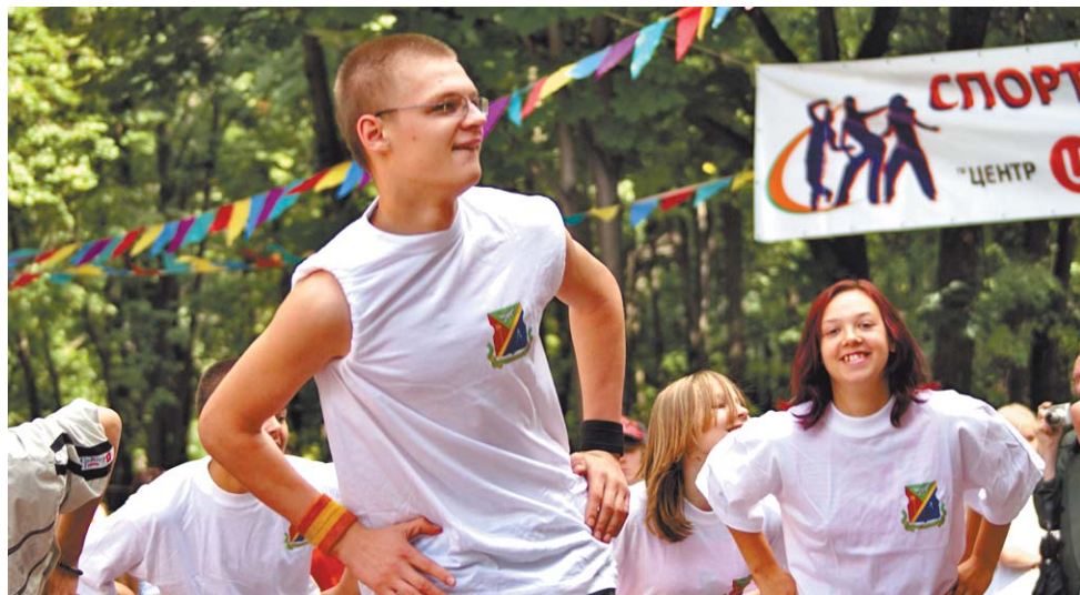
В Бабушкинском парке народ «заряжался» с удовольствием

21 июля в Бабушкинском парке прошла традиционная московская общегородская фитнес-зарядка. Она началась в 11 утра. Под руководством ведущих инструкторов московских фитнес-клубов и Федерации аэробики