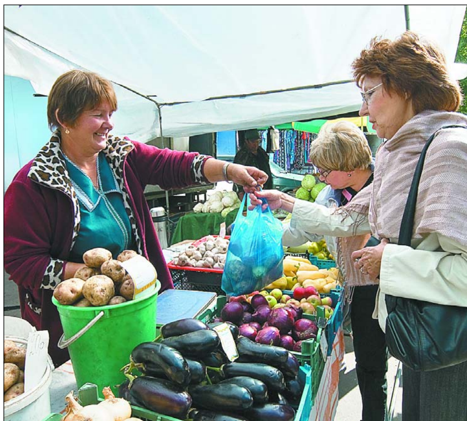
Тайнинская, 24. Теперь у лосиноостровцев будет из чего выбирать

У продавцов арбузов должны быть при себе медицинские книжки, разрешение на торговлю и документы о лабораторных ис-