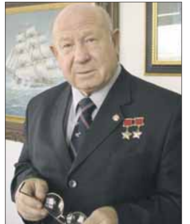
Космонавт Алексей Леонов пришёл на избирательный участок №153 в СВАО одним из первых

— Жители выбирают тех людей, которые должны отстаивать интересы горожан, а это, как правило, те, кто хорошо известен своей гражданской позицией и заслужил ува-