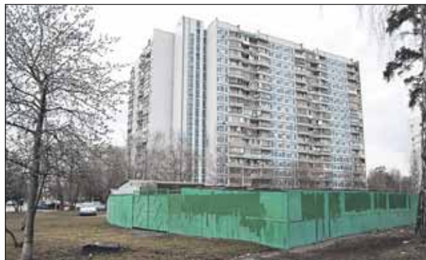
Малыгина, 8. Здесь появится один из народных гаражей

Чтобы более эффективно использовать имеющиеся спортивные объекты, заключены договоры социального партнерства со школами района и строительным колледжем №12 для ведения спортивно-массовой работы с населением. Благодаря этому тренеры муниципального учреждения «Центр досуга и спорта «Лосинка» получили возможность проводить тренировки и спортивные мероприятия на межшкольных