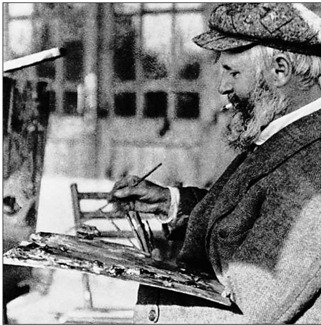
Художник Константин Коровин часто наведывался в здешние места

Заплатить за «Дачный контракт» могли, разумеется, далеко не все. Цена десятины (1,0925 га) доходила до 3000 рублей, поэтому основным контингентом стали предприниматели и представители бо-