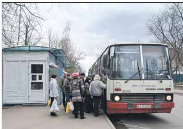
Улица Коминтерна, 22, корп. 1: здесь сделают заездной карман для автобусов

В первоочередной список по Лосиноостровскому