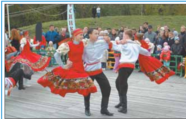
На сцене — хореографический ансамбль «Задоринка» (МУ «Лосинка»)

25 сентября в 16.00 на стадионе «Красная стрела» (ул. Шушенская, 8) — товарищеский матч по регби «Спартак-Лосинка» — «Кентавр» (Бибирево).