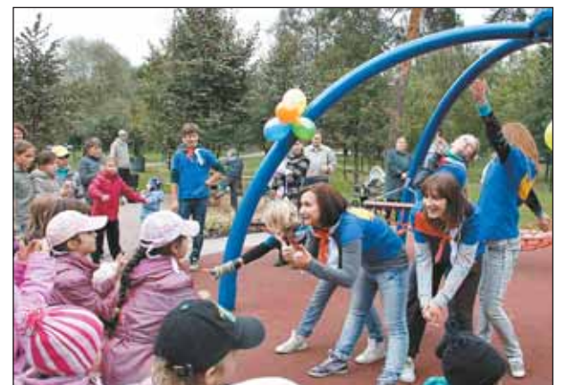
Студенты МАТИ — РГТУ на площадке для детей-инвалидов

Управа района сделала все, чтобы День города запомнился жителям и гостям Лосинки. В парке «Бабушкинский» прошла торжественная часть праздника, в сквере на Оборонной собрались барды, у кадетской школы №1778 открыли табличку на памятнике — зенитке времен войны. А на площадке для детей-инвалидов (пересечение Изумрудной и Напрудной улиц) спортивно-игровую программу представили члены городского студенческого педагогического отряда.