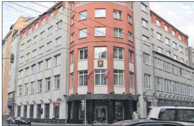
Здание Мосгордумы на Петровке

К исключительной прерогативе Думы относятся: рассмотрение проекта городского бюджета, проекта бюджета территориального государственного внебюджетного фонда города Москвы; утвержде-