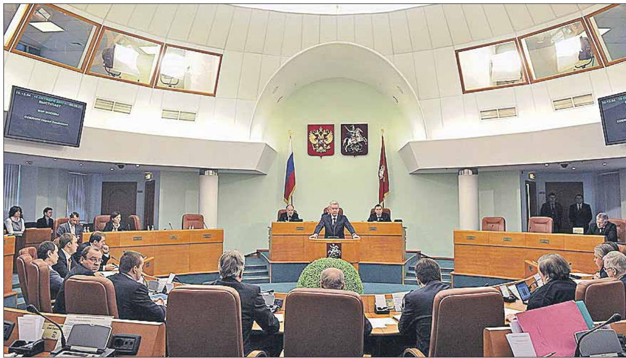
Заседания депутатов Мосгордумы 5-го созыва проходили раз в неделю

В начале 2014 года в истории Мосгордумы начался новый этап. Фракция «Единой России» внесла законопроект о проведении выборов в городской парламент по 45 одномандатным округам.