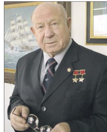
Космонавт Алексей Леонов пришёл на избирательный участок №153 в СВАО одним из первых

— Жители выбирают тех людей, которые должны отстаивать интересы горожан, а это, как правило, те, кто хорошо известен своей гражданской позицией и заслужил ува-