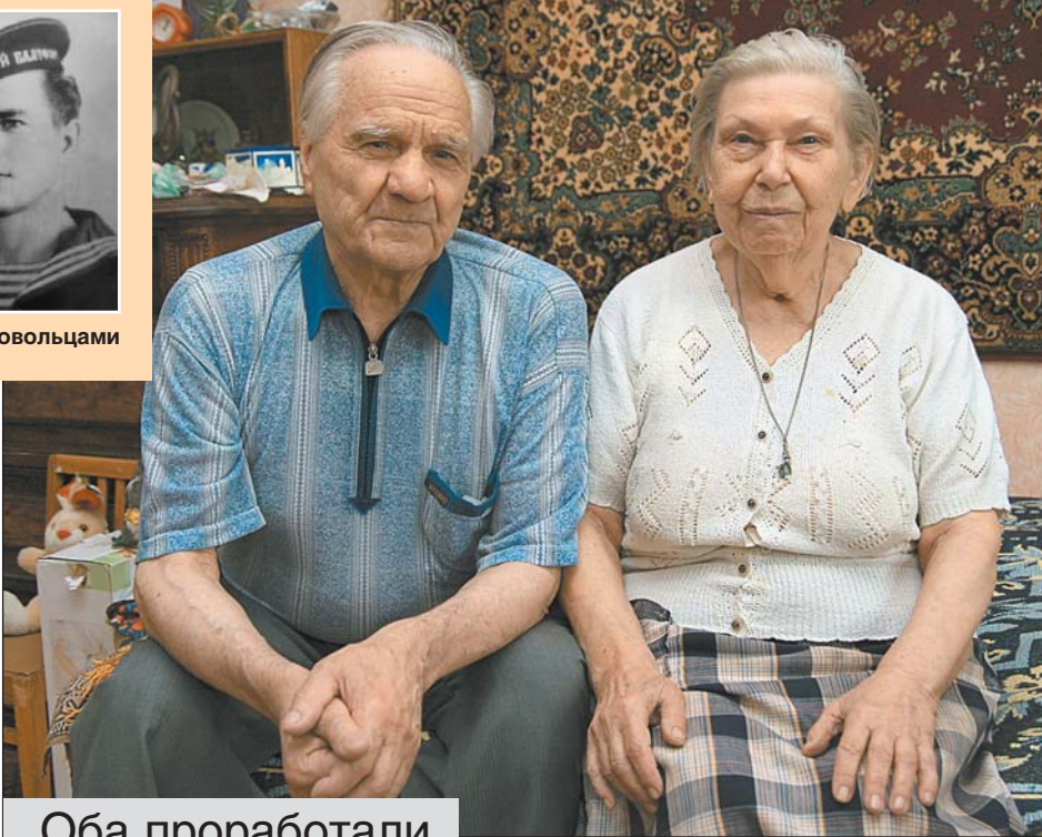
Оба проработали на одном месте более 30 лет

Она была дочкой артиста, по совместительству художника-декоратора, и главной медсестрой железнодорожной больницы