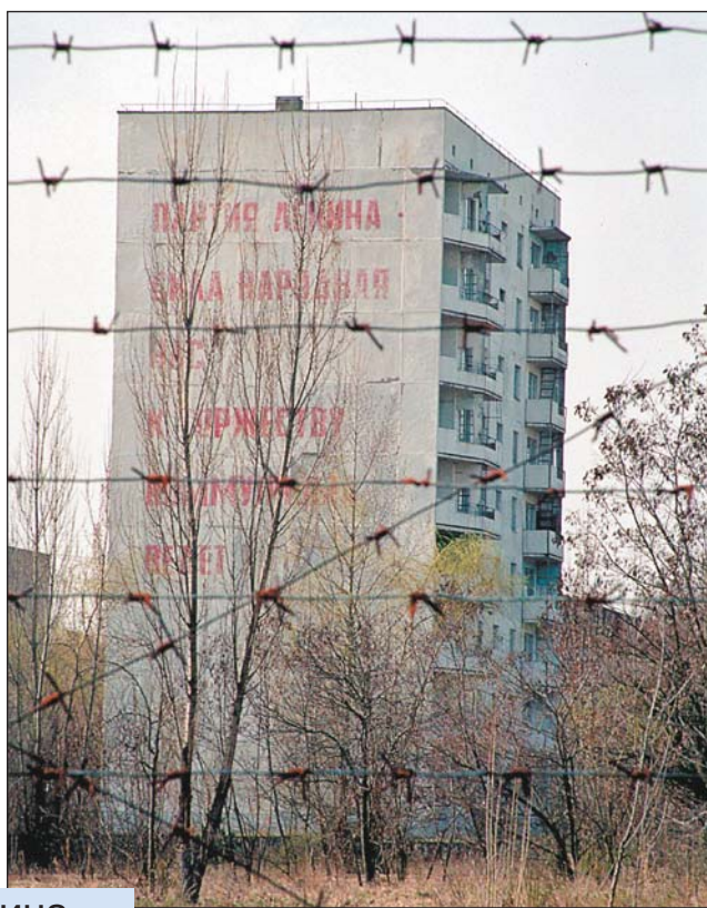
Припять через несколько лет после взрыва на ЧАЭС