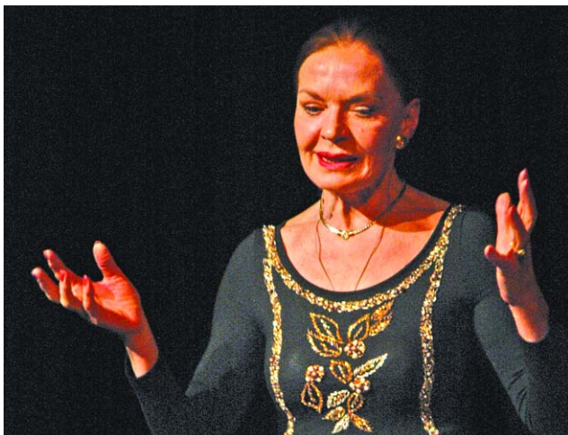
Монологом Екатерины II актриса смутила депутатов Госдумы

— Помню, как с фильмом «Журавушка» я поехала на кинофестиваль в Испанию. Гран-при мне должна была вручать сама Одри Хепберн. И представьте: я выхожу на сцену, а навстречу мне выплывает легкое грациозное существо с осиной талией. А в руках несет мне награду —