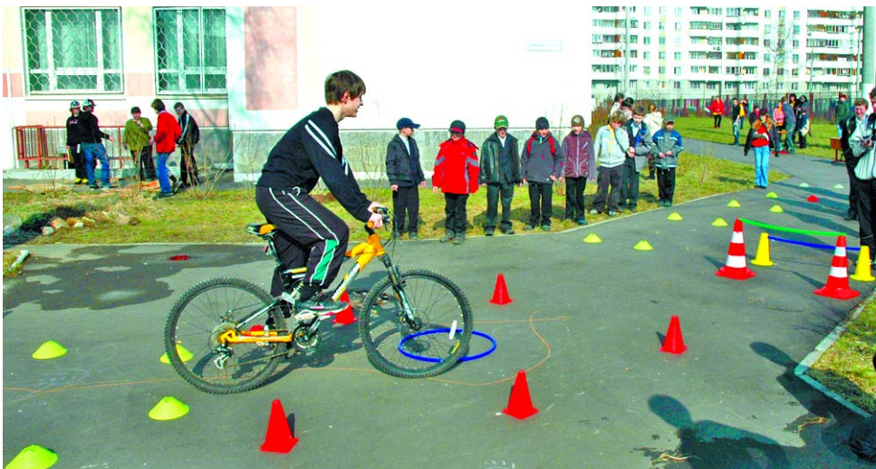
Место для спортплощадки есть, нужно только построить