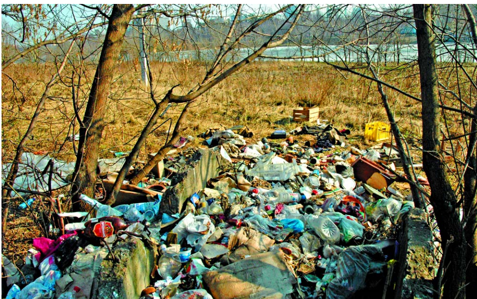
Первым делом предстоит убрать берега Джамгаровского пруда

— По плану они должны пройти 14 и 21 апреля. В них могут принять участие все желающие. Уже определены территории, где пройдет уборка силами ДЕЗа, управы, муниципалитета, школьников, студентов и просто неравнодушных жителей. 14 апреля планируем привести в порядок территорию между Джамгаровским прудом и Перловским кладбищем. А затем пойдем вдоль кладбища в сторону МКАД. 21 апреля планируем убрать территорию с другой стороны пруда, в районе госпиталя ветеранов войн №3. После этого двинемся на юг и приведем в порядок Бабушкинский парк — любимое место отдыха. Конечно, мы очень рассчитываем на помощь жителей в уборке своих дворов.