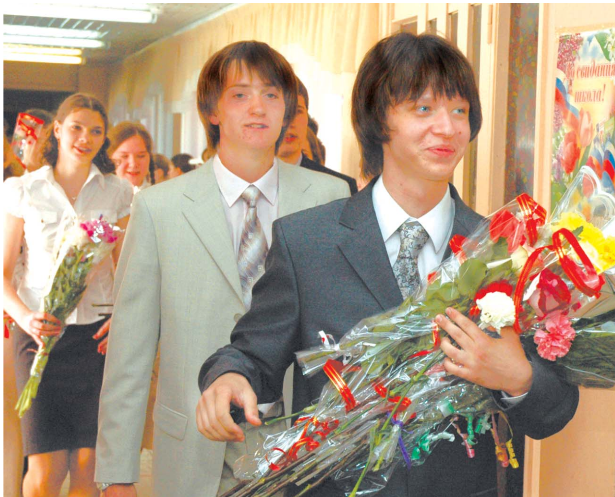
Вчерашние ученики школы №763 ушли в большую жизнь