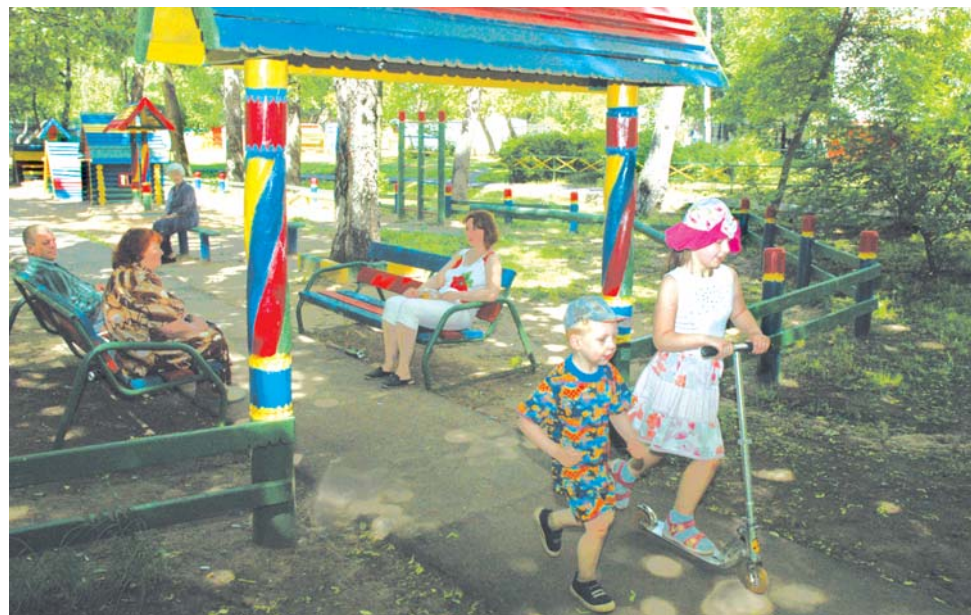
Детская площадка в Янтарном проезде, 3 — образец для подражания