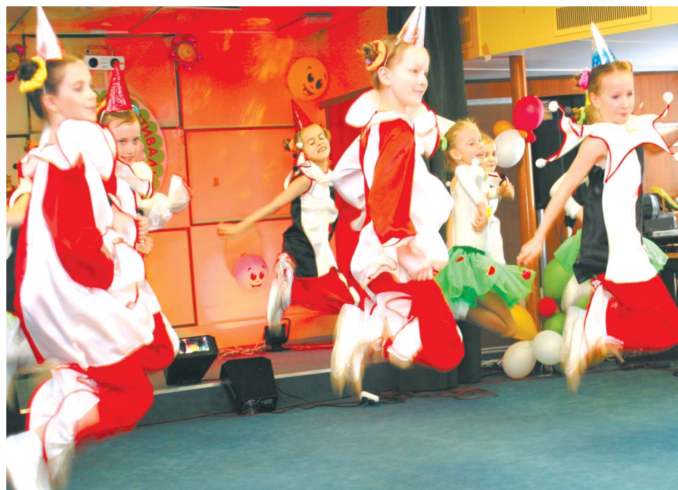
В наших артистов влюбилось все Поволжье

Дорогие избиратели, спасибо вам за поддержку, помощь и доверие, которое вы оказываете мне.