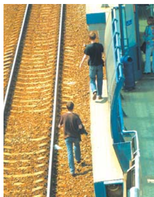
Станция Лосиноостровская: так ходить опасно