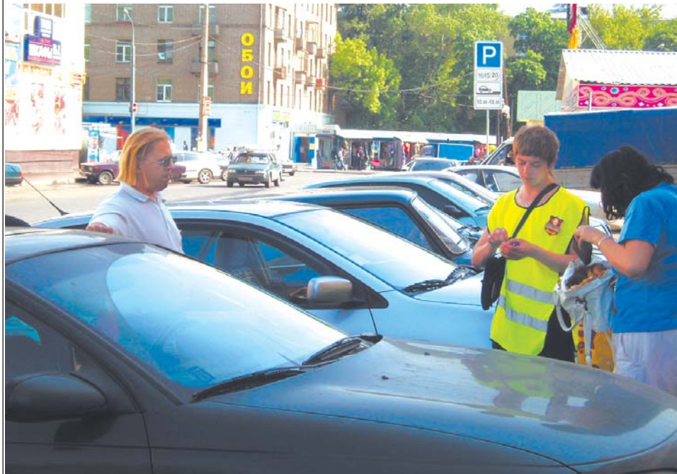
Не успел остановиться — перед машиной вырастает паренек в зеленой униформе

«Почему стоянка у Лосиноостровского рынка стала платной? С какой стати?»