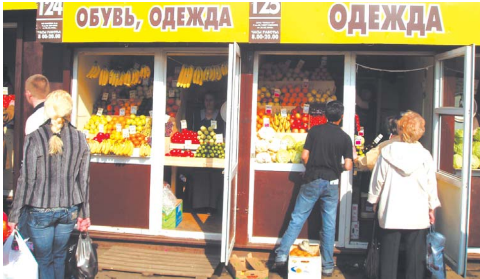
Кому бананы 43-го размера?!

Ждем ваши фотографии на losinka@zbulvar.ru.