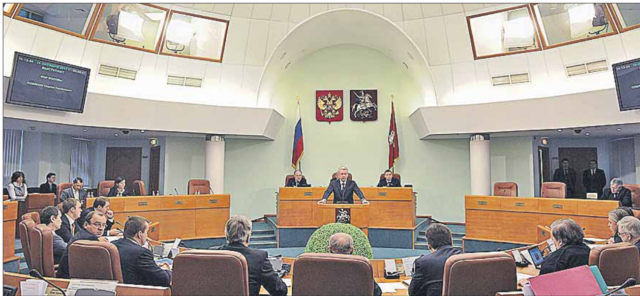
Заседания депутатов Мосгордумы 5-го созыва проходили раз в неделю

Согласно главе 9 регламента, депутаты имеют право образовывать добровольные депутатские объединения — фракции, блоки, клубы, другие объединения на основе свободного волеизъявления.