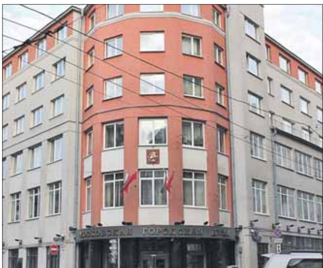
Здание Мосгордумы на Петровке

ва также выбирали на четыре года, но уже по другой схеме: 15 из них избирали по одномандатным округам и 20 — по городскому избирательному округу от избирательных объединений.