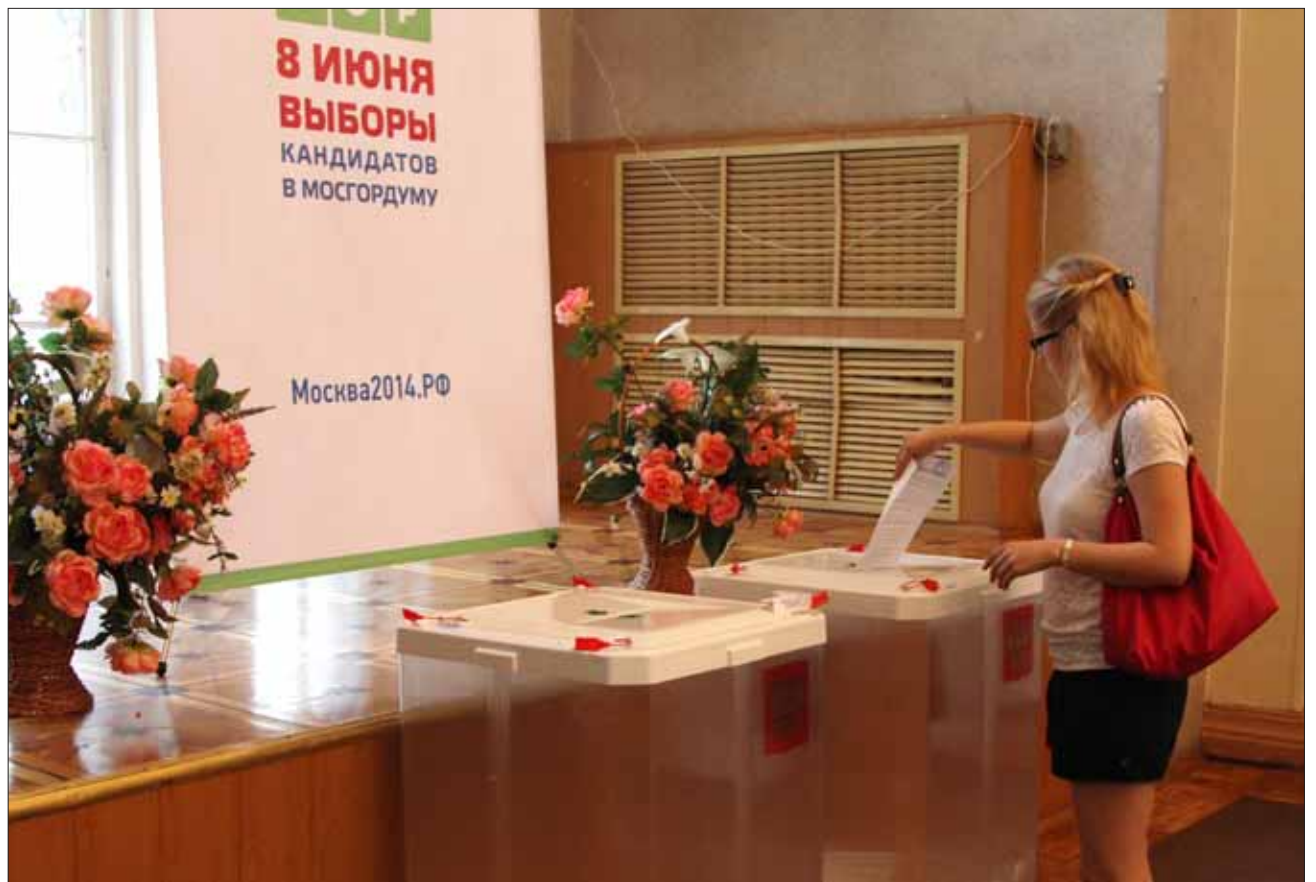
Голосование на избирательном участке по адресу: 3-я Северная линия, 17

По итогам предварительного голосования на политической арене появи-