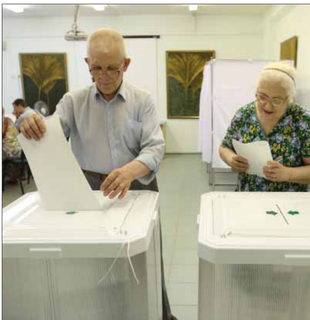
Избирательный округ №12 на улице Седова, 4 корпус 1