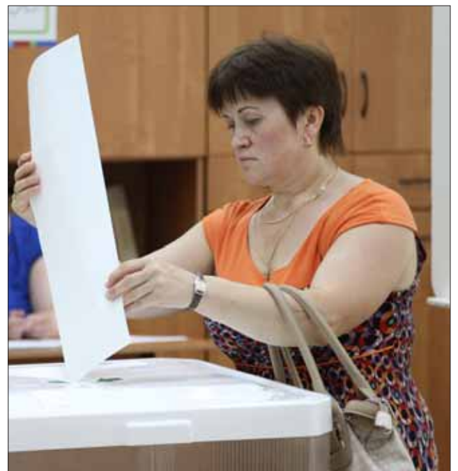
Выборы на улице Ленской, 6