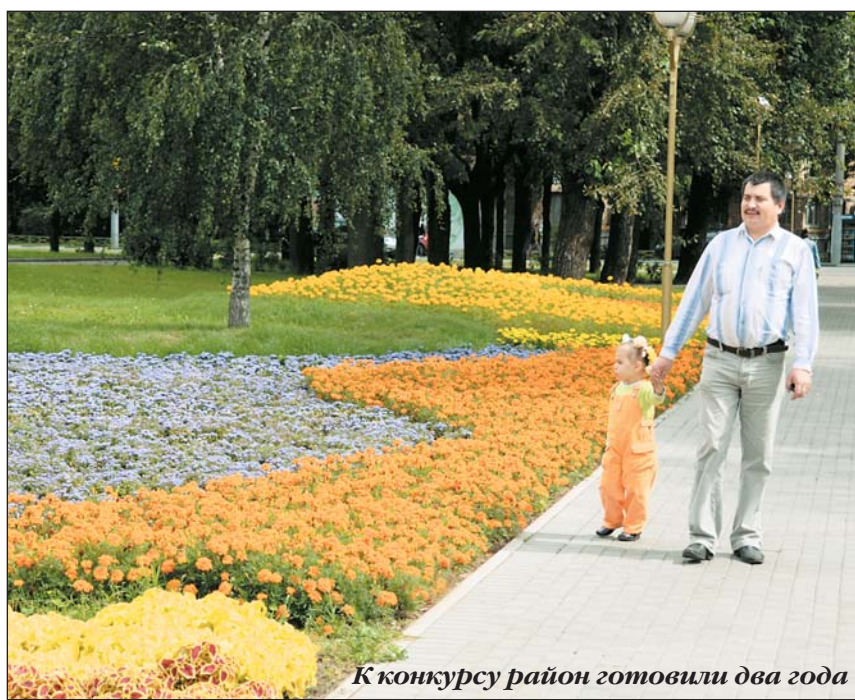
К конкурсу район готовили два года

Лосинка борется за звание самого благоустроенного района в Москве