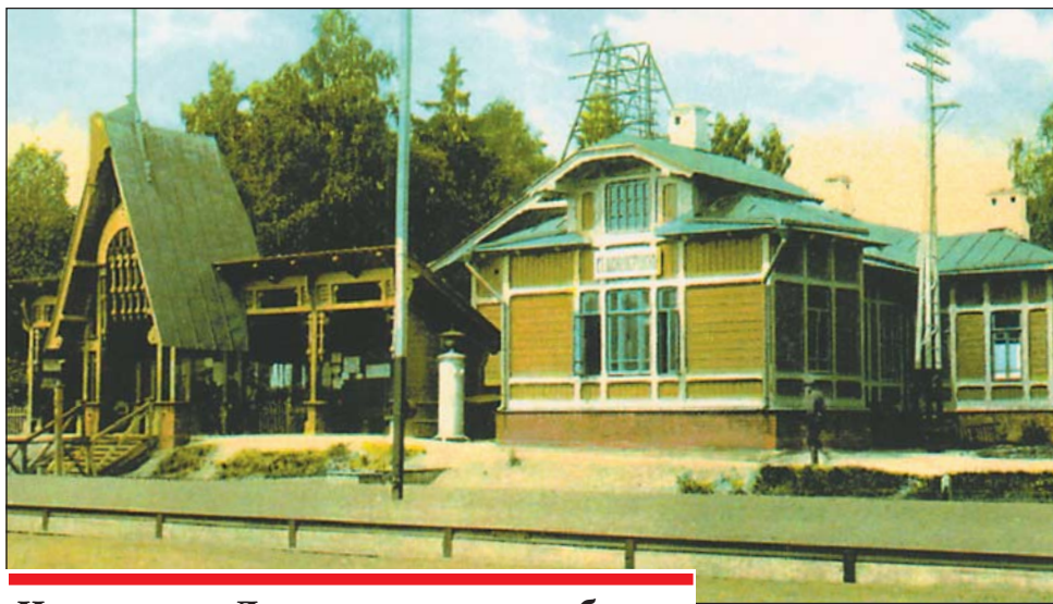
На станции Лосиноостровская был скромный деревянный вокзальчик с буфетом и парикмахерской

Впрочем, все по порядку. Вот справа за сквером с памятником Ленину — кирпичное здание железнодорожной поликлиники. С тыльной стороны к ней прилепилось главное злчное место. (И к тому же единственное.) Почему-то безымянную рюмочную горделиво называли «Голубой Ду-