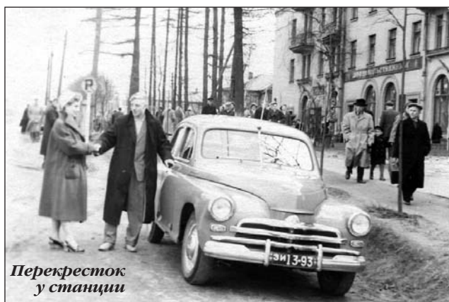
Перекресток у станции