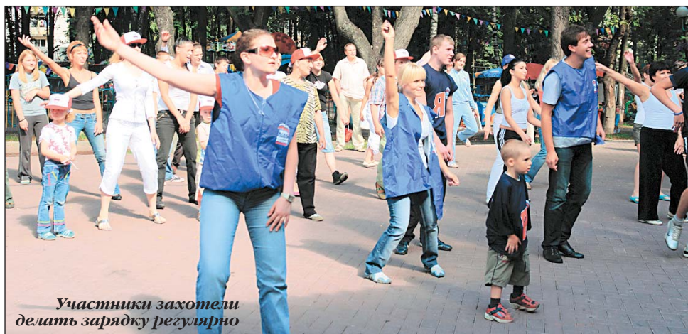
Участники захотели делать зарядку регулярно

В парке культуры и отдыха «Бабушкинский» (ул. Менжинского, 6) состоялась городская фитнес-зарядка под девизом «Спорт с настроением!». В ней приняли участие жители районов Лосиноостровский, Южное Медведково, Северное Медведково, Отрадное и Ярославский, а также фитнес-клуб «Примavera», ООО «Сага-техникс»,