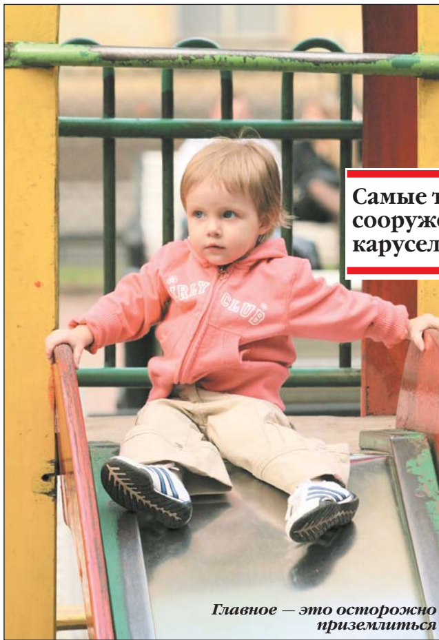
Главное — это осторожно приземлиться