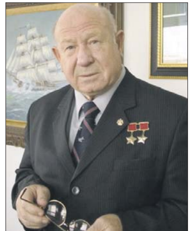
Космонавт Алексей Леонов пришёл на избирательный участок №153 в СВАО одним из первых

— Жители выбирают тех людей, которые должны отстаивать интересы горожан, а это, как правило, те, кто хорошо известен своей гражданской позицией и заслужил ува-