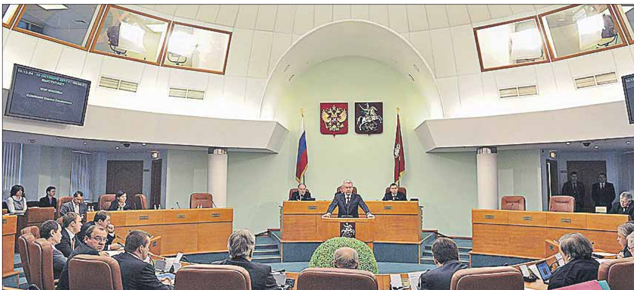
Заседания депутатов Мосгордумы 5-го созыва проходили раз в неделю

В состав Думы 5-го созыва избрали уже 17 одномандатников, а от избирательных объединений — 18 депутатов. Было ещё одно новшество: депутатов выбрали на пять лет.