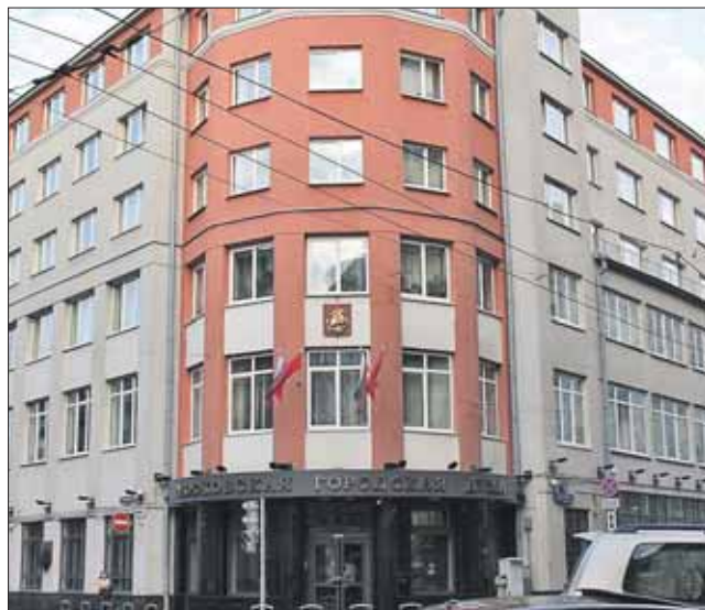
Здание Мосгордумы на Петровке

После присоединения к Москве новых территорий было принято решение увеличить депутатский корпус до 45 человек.