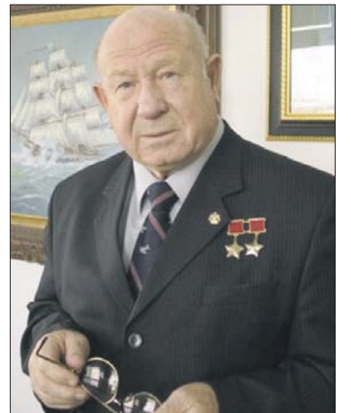
Космонавт Алексей Леонов пришёл на избирательный участок №153 в СВАО одним из первых

— Жители выбирают тех людей, которые должны отстаивать интересы горожан, а это, как правило, те, кто хорошо известен своей гражданской позицией и заслужил ува-