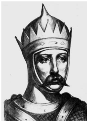
Основатель Москвы Юрий Долгорукий

В нынешнем году Москве исполняется 860 лет. Хороший повод вспомнить, чем жила наша столица все это время с 1147 года по 2007-й — с XII века по XXI.