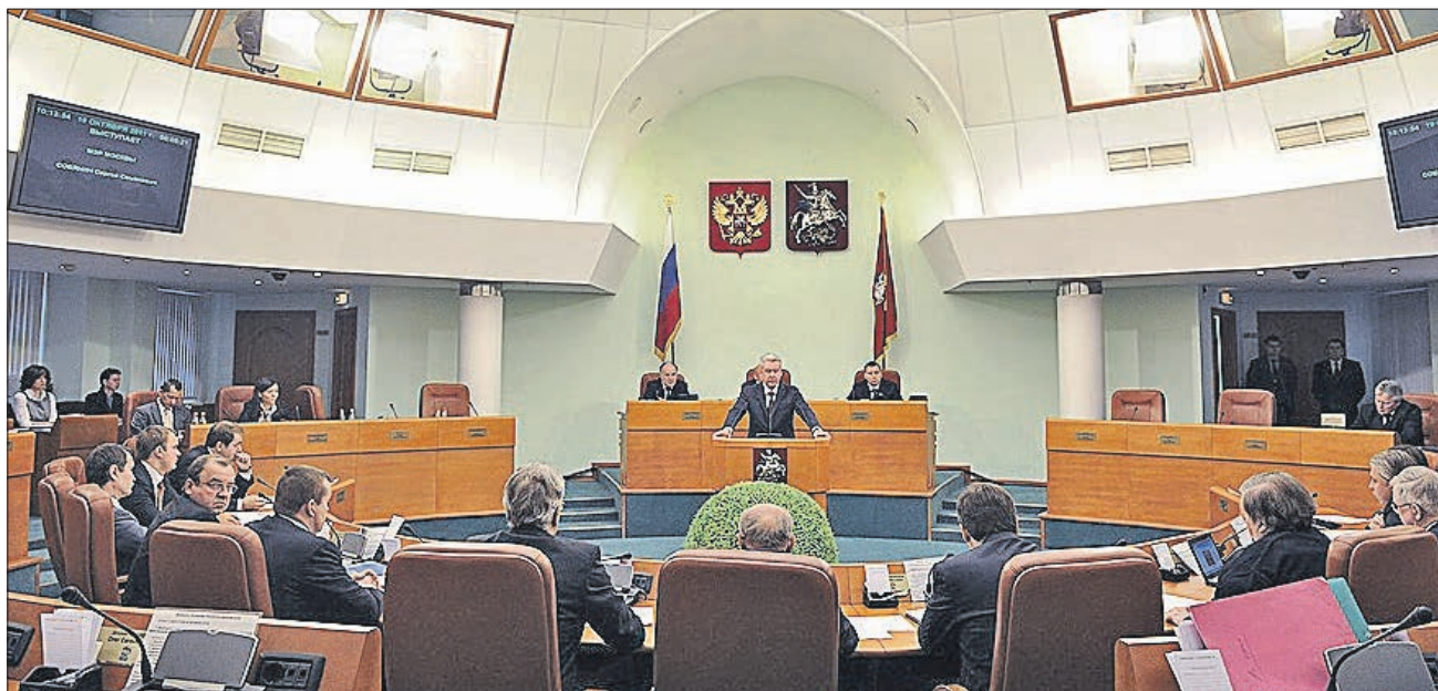
Заседания депутатов Мосгордумы 5-го созыва проходили раз в неделю

В начале 2014 года в истории Мосгордумы начался новый этап. Фракция «Единой России» внесла законо-