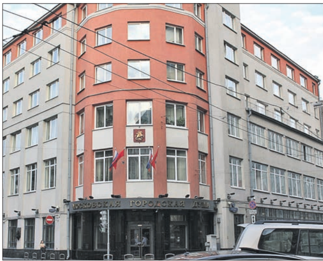
Здание Мосгордумы на Петровке