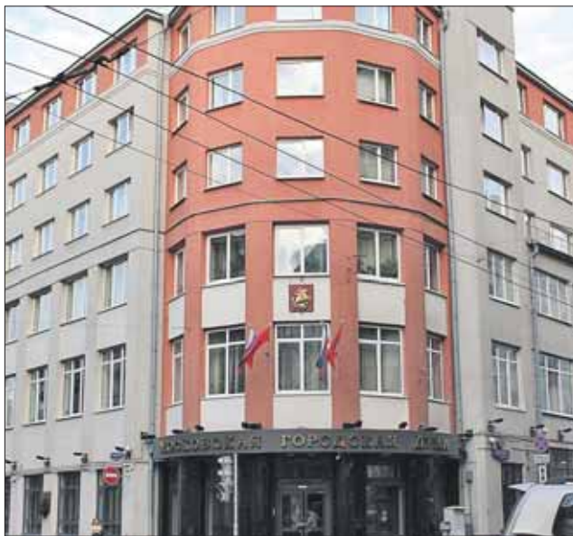
Здание Мосгордумы на Петровке

Выборы депутатов Думы первых трёх созывов проходили по 35 одномандатным (мажоритарным) округам. Депутатов выбирали на четыре года.