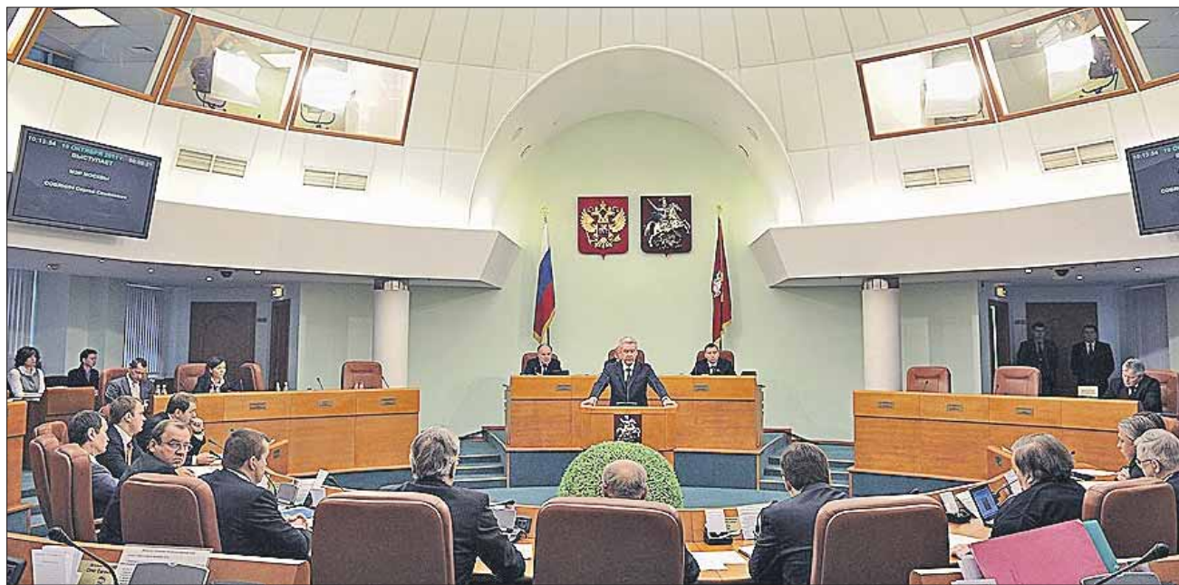
Заседания депутатов Мосгордумы 5-го созыва проходили раз в неделю