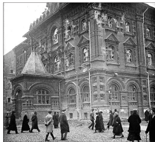
В здании Мосгордумы после революции 1917 года был Музей В.И.Ленина

Управление городским хозяйством было поручено Совету районных дум, а в мар-