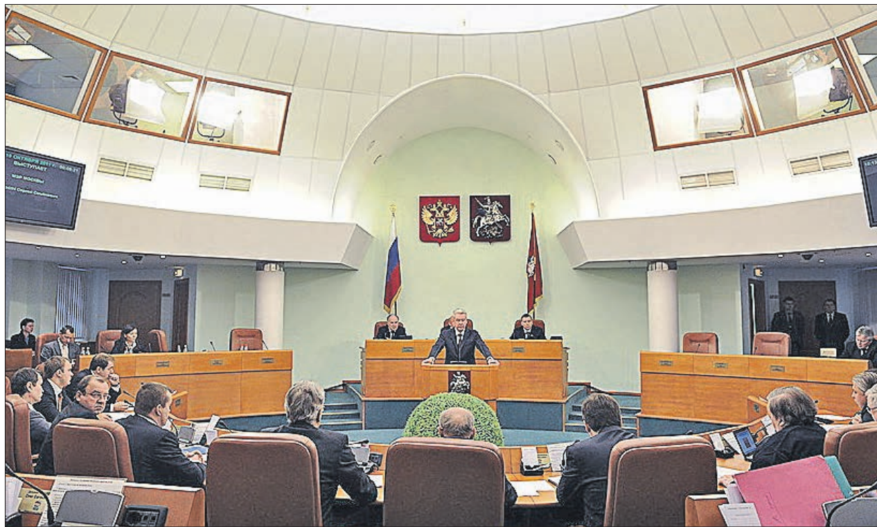
Заседания депутатов Мосгордумы 5-го созыва проходили раз в неделю