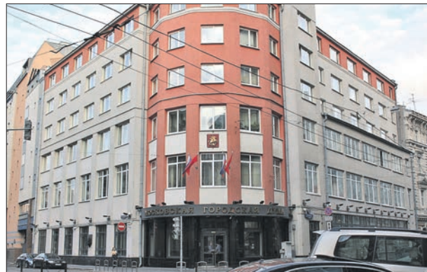
Здание Мосгордумы на Петровке

Выборы депутатов Думы первых трёх созывов проходили по 35 одномандатным