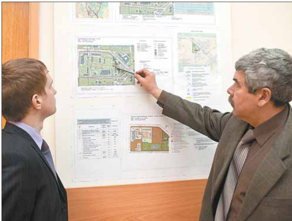
Реальные потребности милиции уже сейчас шире архитектурных проектов

для парковки. А ведь понадобятся места и для машин сотрудников, и для дежурных авто, и для транспорта посетителей.