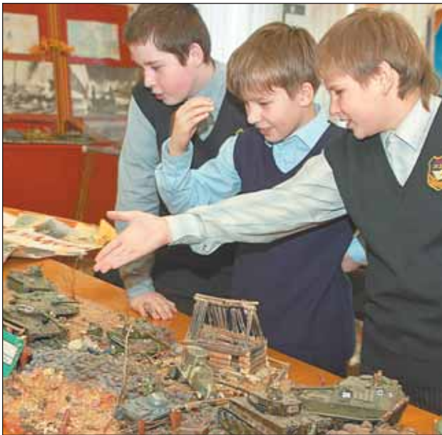
Фрагмент битвы за Москву ребята воспроизвели своими руками

— Главное, что нам удалось собрать фронтовые фотографии, письма и личные вещи, солдатские каски,