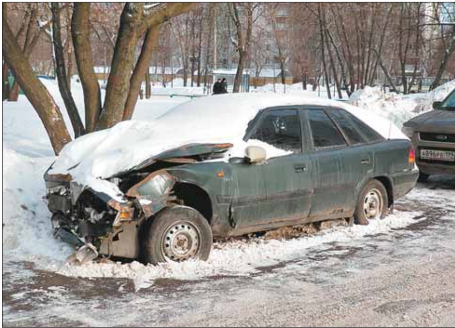
Брошенная машина на улице Тайнинской, 24

Если номер на машине есть, с владельцем пытаются связаться, определив его по базам данных. Если автомобиль продан по довереннос-