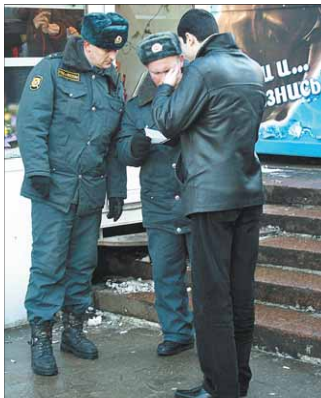
Сотрудники в форме — сдерживающий фактор для правонарушителей

В отдел постоянно приходится доставлять и коробейников. За несанкционированную торговлю в поездах и на станции взимаются штрафы от 2500 рублей. Предлагают не только сомнительный товар, но и явно опасный. Так, в милицию обратился мужчина, которому неизвестный предлагал боевые патроны к пистолету Макарова. Торговца задержали со-