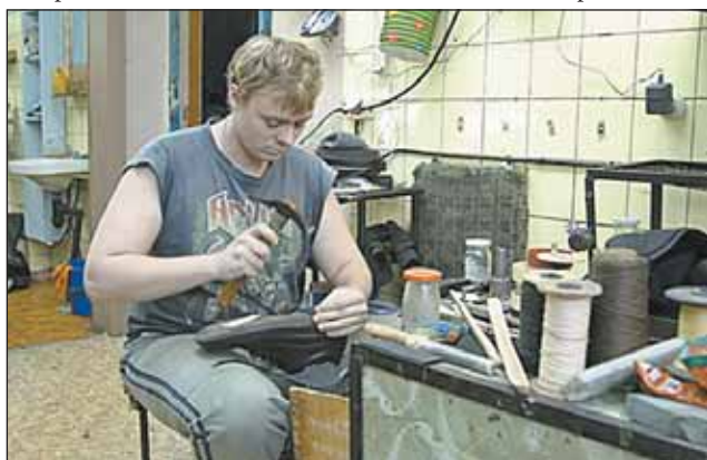
Мастерских по ремонту обуви в районе пока не хватает

Кстати, у нас один из самых дешевых районов в Москве. Стоимость потребительской корзины на