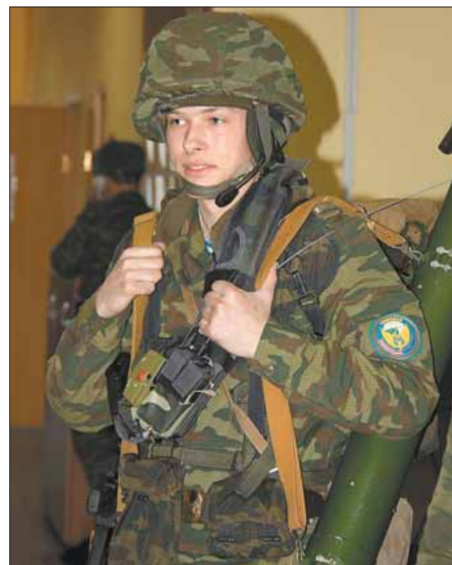
Полная экипировка бойца весит 30 килограммов

с парашютом, и марш-броски в полной экипировке, которая весит у «химиков» более 30 кило. Впрочем, по словам участников поездки, условия в части отнюдь не спартанские: питание отменное — сами пробовали, в казармах — не привычные ряды солдатских коек, а уютные комнаты на 2-4 человека. Чтобы не только строевые песни пел, но и что-нибудь для души, привезли Виталию из Лосинки новую гитару.