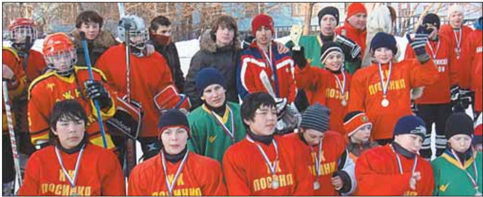
Команда-победительница «турнира четырех»