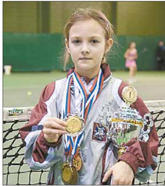
Аня Калинская играет в теннис с четырех лет