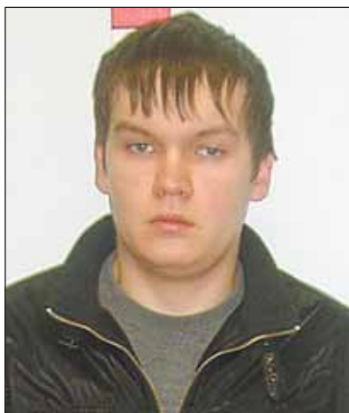
Если вы пострадали от действий этого человека, звоните по телефонам: (499) 185-0233, 185-4111, 184-1955

Мошенник не заставил себя долго ждать. Пенсионер передал злоумыш-