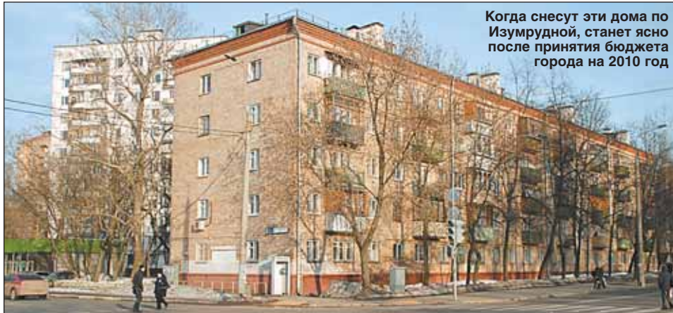
Когда снесут эти дома по Изумрудной, станет ясно после принятия бюджета города на 2010 год

— Финансовые возможности инвестора задержали его выход на площадку. Были проблемы с оформлением поручения и с оформлением договора аренды земельного участка. Сегодня эти вопросы решены, утвержден график производства работ, договор с инвестором находится на регистрации. Как только будут оформлены земельно-правовые отношения, на площадку выйдет подрядчик.