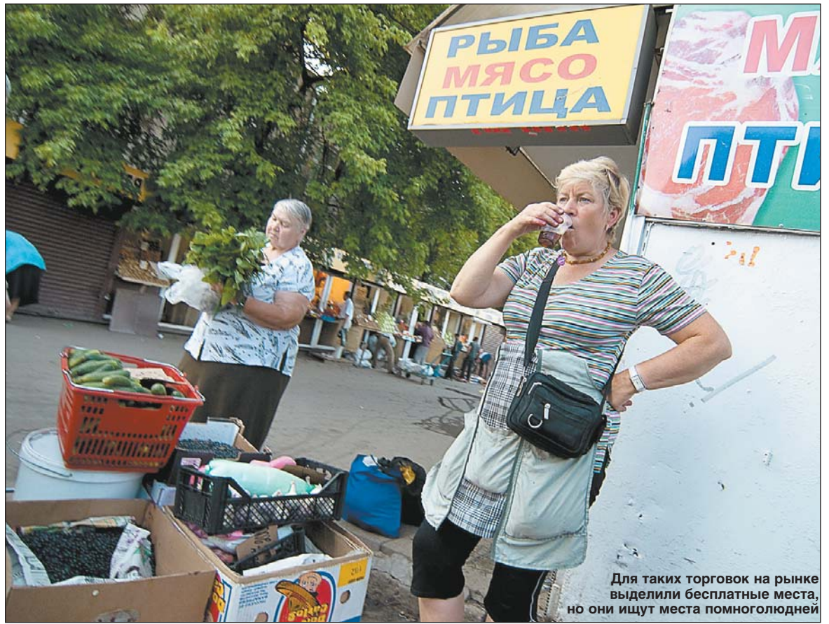
Для таких торговцев на рынке выделили бесплатные места, но они ищут места помногочелудней