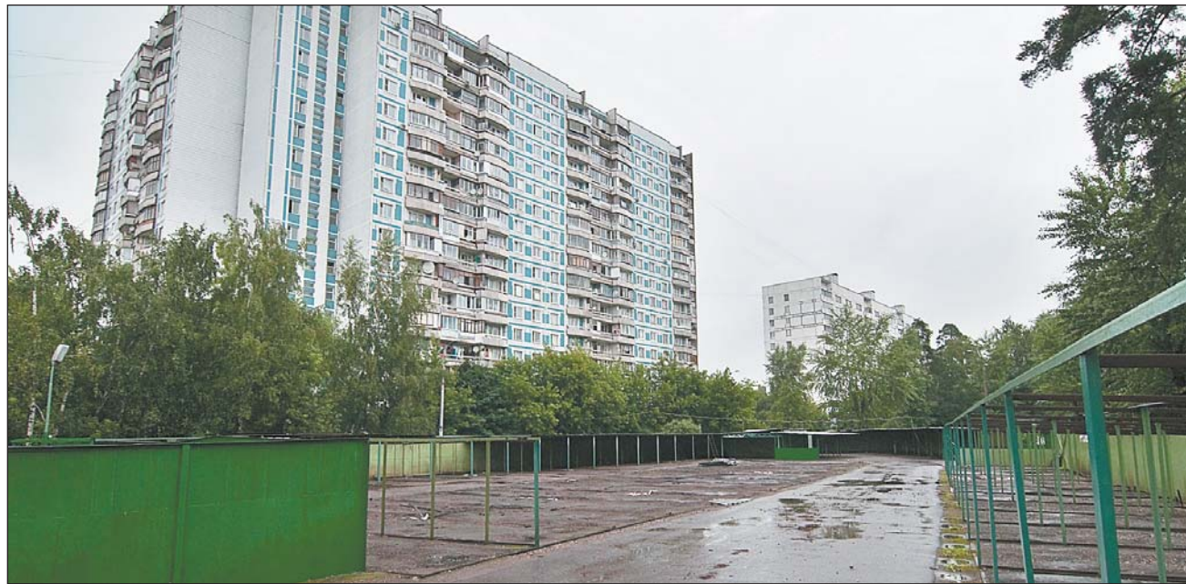
Прежние хозяева автостоянки на Малыгина, 8, переехали — можно строить народный гараж