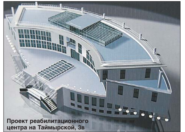
Проект реабилитационного центра на Таймырской, 3в