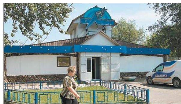
Анадырский, 16: «Вулкан» отдали кулинарам