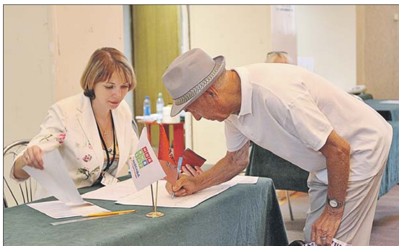
Голосование на избирательном участке по адресу: 3-я Северная линия, 17

одномандатных округов кандидатам очень сложно было нащупать тему своего выступления, выделить ключевые точки. В то же