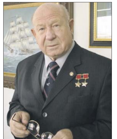
Космонавт Алексей Леонов пришёл на избирательный участок №153 в СВАО одним из первых

— Жители выбирают тех людей, которые должны отстаивать интересы горожан, а это, как правило, те, кто хорошо известен своей гражданской позицией и заслужил ува-