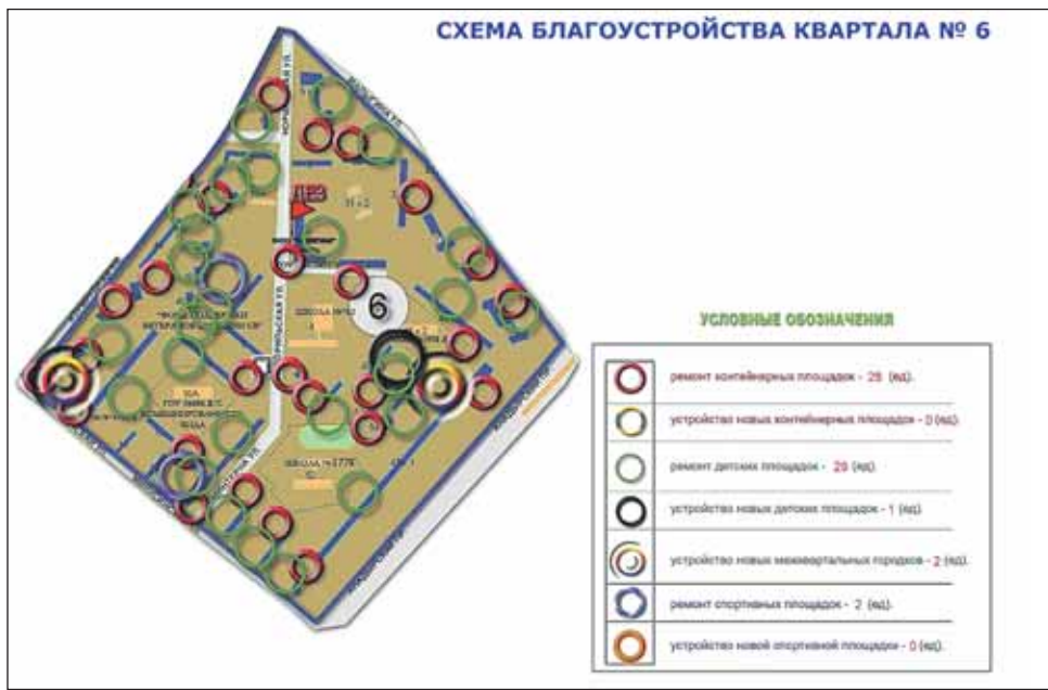
Автор проекта — А.В.Винниченко