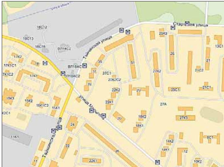
Улица Тайнинская раньше вела в одноименное село

Интересно проследить, как проходили старые дороги. Одна из них идет на север — пересекает Ичку, а уже много дальше — и Клязьму у села Осташкова. Через несколько десятилетий эта дорога станет Осташковским шоссе. Но если сейчас оно переходит в Енисейскую, то в 1914 году эта дорога шла криво — переходила в нынешнюю Осташковскую, а затем в современную Летчика Бабушкина. На месте нынешней Тайнинской и раньше была дорога, она вела в село Тайнинское. Только 100 лет назад эта улица была более прямой и не искрив-