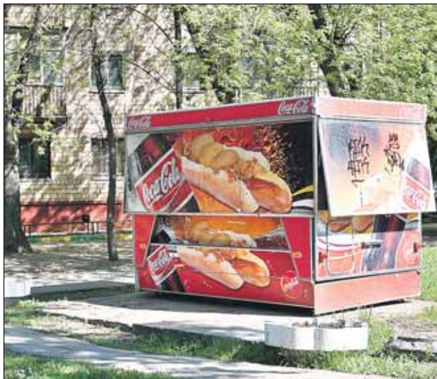
Тайнинская, 3: профиль киоска изменится

Правительство Москвы утвердило схемы размещения объектов мелкорозничной торговли. Как уже рассказывала наша газета, с 1 июля вся уличная торговля будет размещена в специальных зонах (нововведение не коснется только киосков с печатью и проездными билетами — они останутся на прежних местах). Схемы торговых зон были разработаны Москомархитектурой с учетом предложений префектуры округа и управ районов.