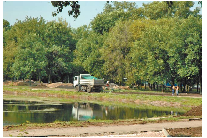
На Торфянке будет фонтан

— Гуманитарные — литературу, историю. Особенно историю. Я много читал. Были даже определенные мысли о том, чтобы связать свою жизнь с этой наукой. Но судьба распорядилась иначе.