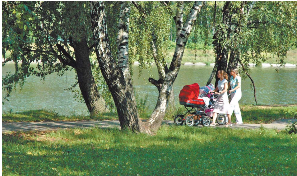
Гулять у пруда стало приятнее

О чем спрашивали жители руководителей района