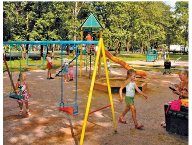
В дворике на Тайнинской есть где поиграть детям