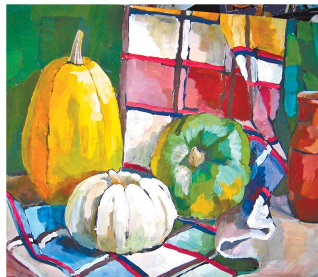
Натюрморт учащейся школы №1188 Юлии Гавриловой, 8 «Б»

Вашу рекламу прочитают все жители Лосиноостровского района 406-8382 407-5200 689-2073