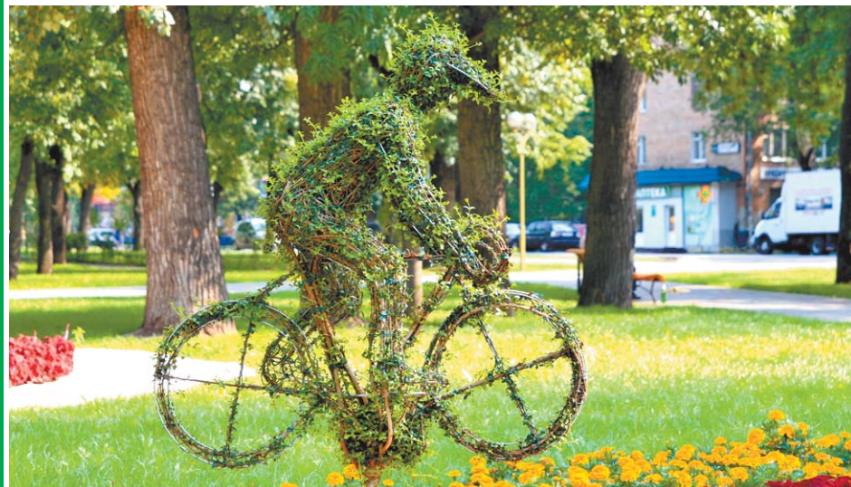
Этому велосипедисту можно ездить по газонам

Здесь скоро откроется VI окружной фестиваль цветников