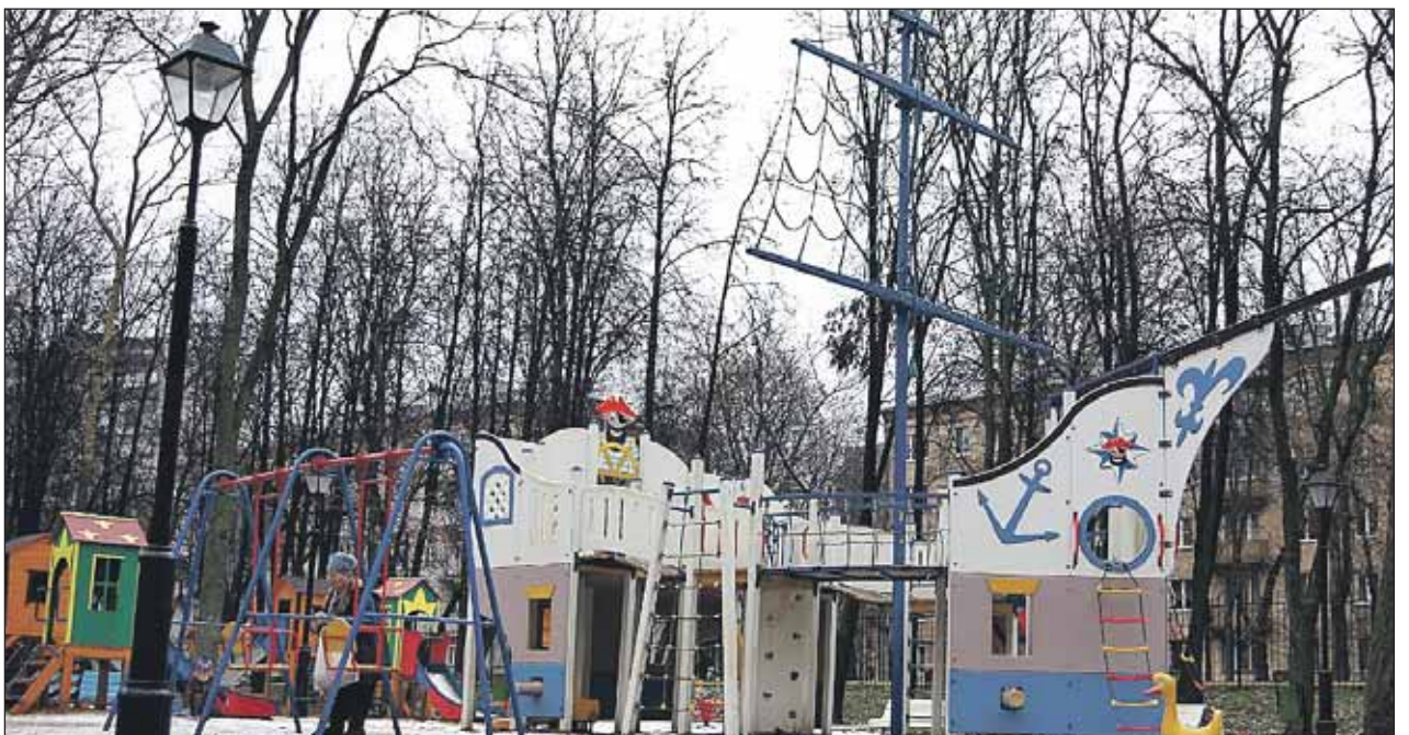
В Бабушкинском парке пришвартовался корабль