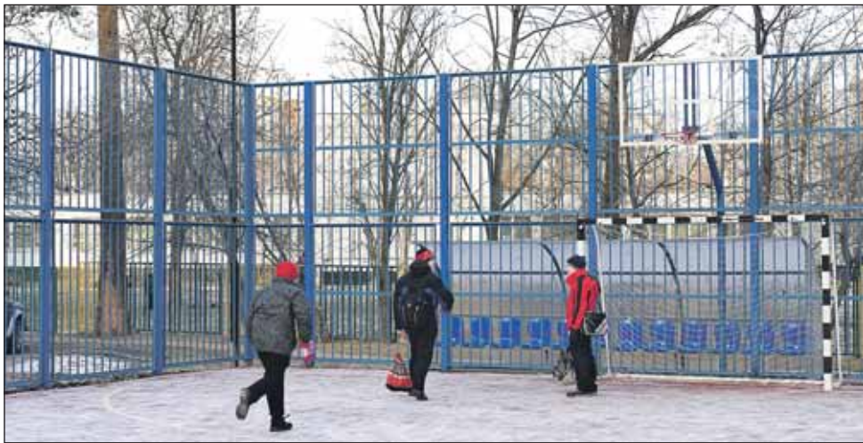
Спортплощадка на улице Малыгина, 8-10

Как спортивные объекты района подготовлены к зиме