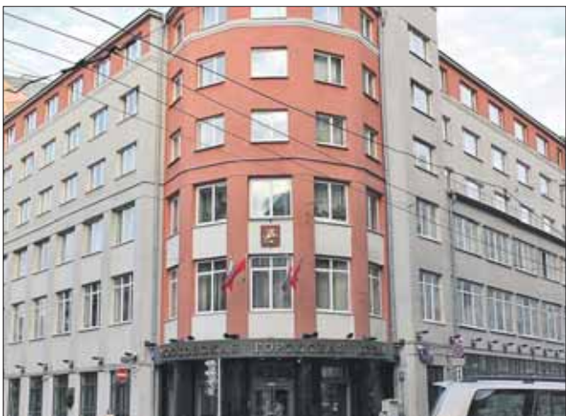
Здание Мосгордумы на Петровке

же контроль за их исполнением. Законами города Москвы устанавливаются региональные и местные налоги и сборы, порядок предоставления льгот по ним, а также конкретные размеры ставок и налоговых льгот по федеральным налогам в пределах прав, предоставляемых субъектам Российской Федерации федеральным законодательством. Дума определяет порядок деятельности органов местного самоуправления, устанавливает порядок регистрации уставов муниципальных образований и распределения доходов от региональных налогов и сборов, иных доходов города Москвы между бюджетом города и бюджетами муниципальных образований, а также устанавливает источники доходов бюджетов муниципальных образований и объединение или преобразование муниципальных образований, установление или изменение их территорий с учётом мнения населения муниципальных образований.