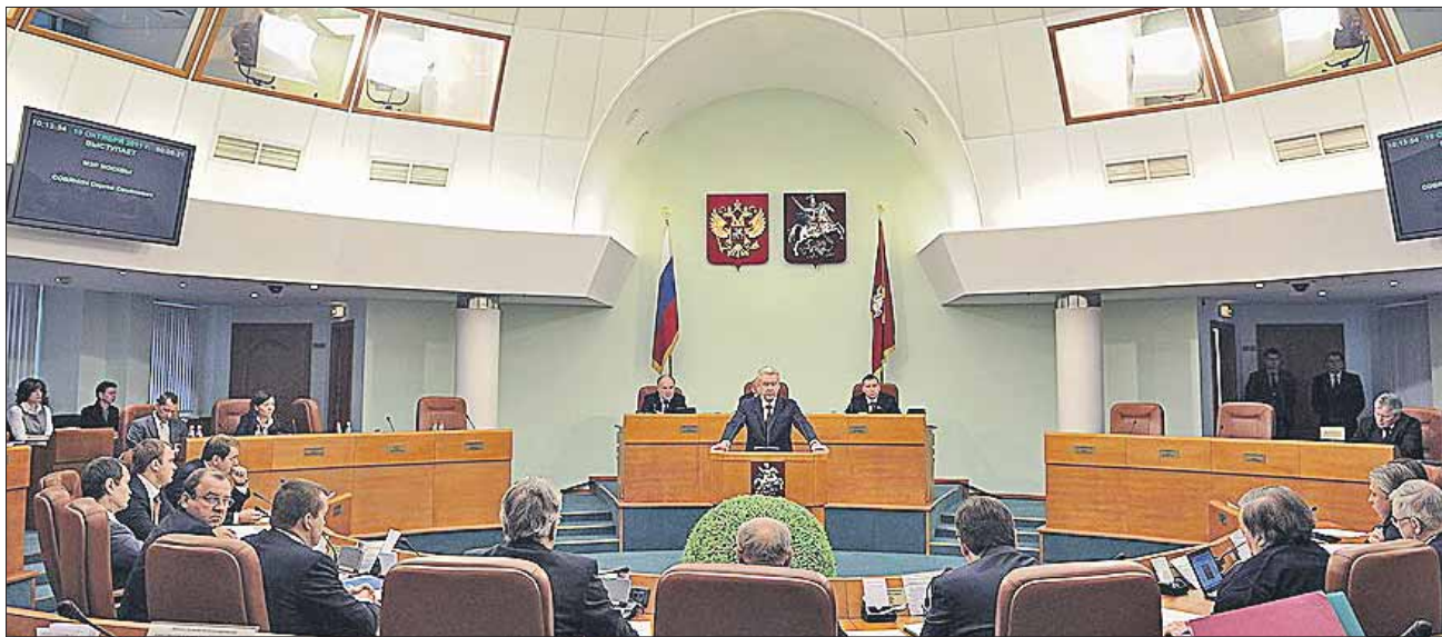
Заседания депутатов Мосгордумы 5-го созыва проходили раз в неделю

Выборы депутатов Думы первых трёх созывов проходили по 35 одномандатным (мажоритарным) округам. Депу-