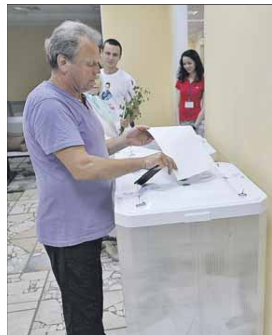
Голосование на избирательном участке по адресу: 1-я Останкинская улица, 29