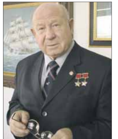
Космонавт Алексей Леонов пришёл на избирательный участок №153 в СВАО одним из первых

— Жители выбирают тех людей, которые должны отстаивать интересы горожан, а это, как правило, те, кто хорошо известен своей гражданской позицией и заслужил ува-