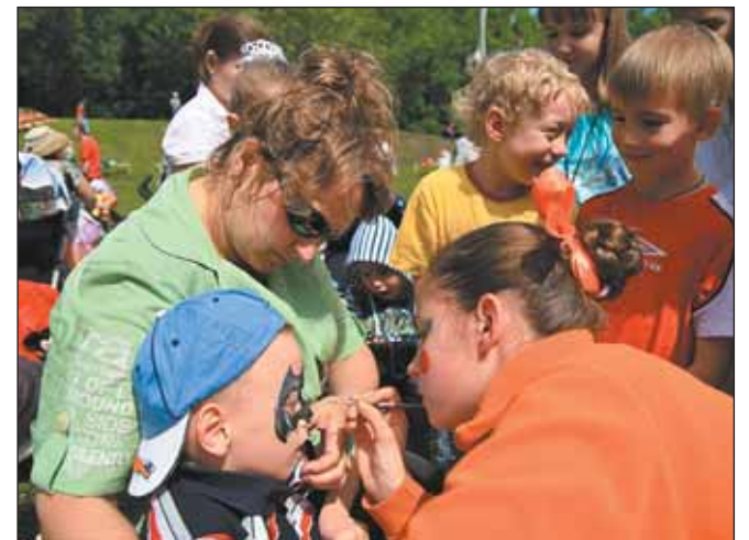
Маленькие гости праздника буквально менялись в лице