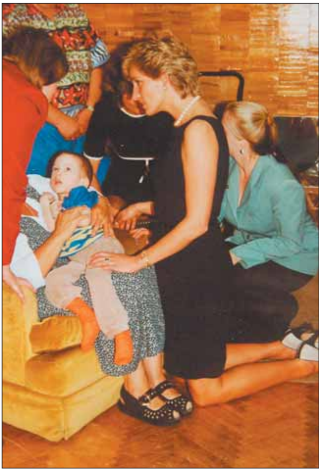
Леди Диана в школе на Таймырской