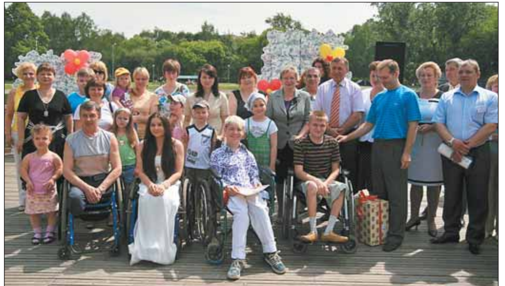
Подопечные клуба инвалидов живут творчески