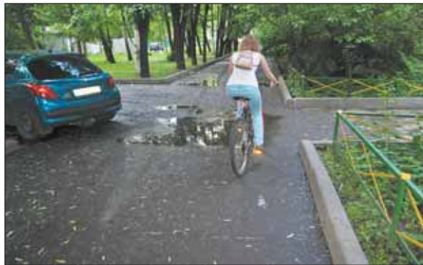
У дома 9 по Шушенской после дождя можно двигаться только на велосипеде

У дома 9 на Шушенской воды нет, но асфальт покрыт слоем влажной земли: во время ливня нанесло с газона. Чуть не упал! После дождя тут застаивается вода. «Пробраться можно только на велосипеде!» — уверяют две девушки из