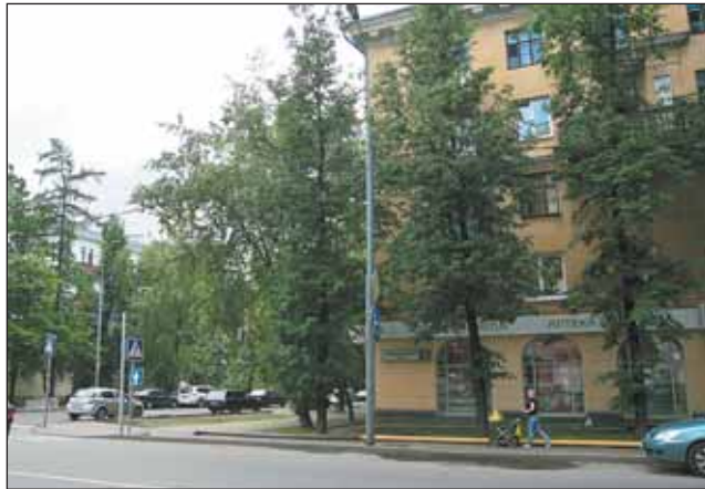
Улица Коминтерна, 13

коммунисты. Наконец, в 4-м «рулили» американские социалисты. Наша улица названа в честь «единственно