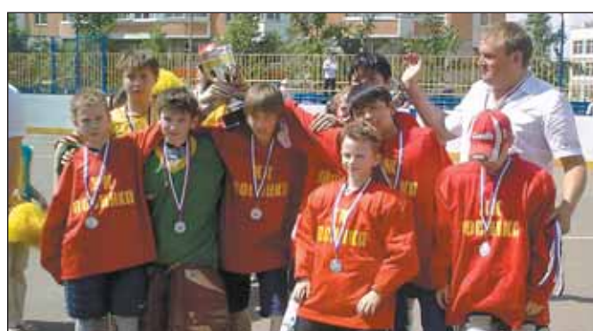
Наши хоккеисты уступили только ребятам из Выхина