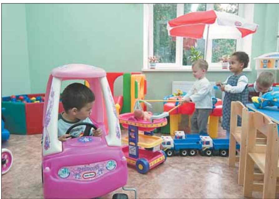
Детский сад на Тайнинской открылся прошлой осенью