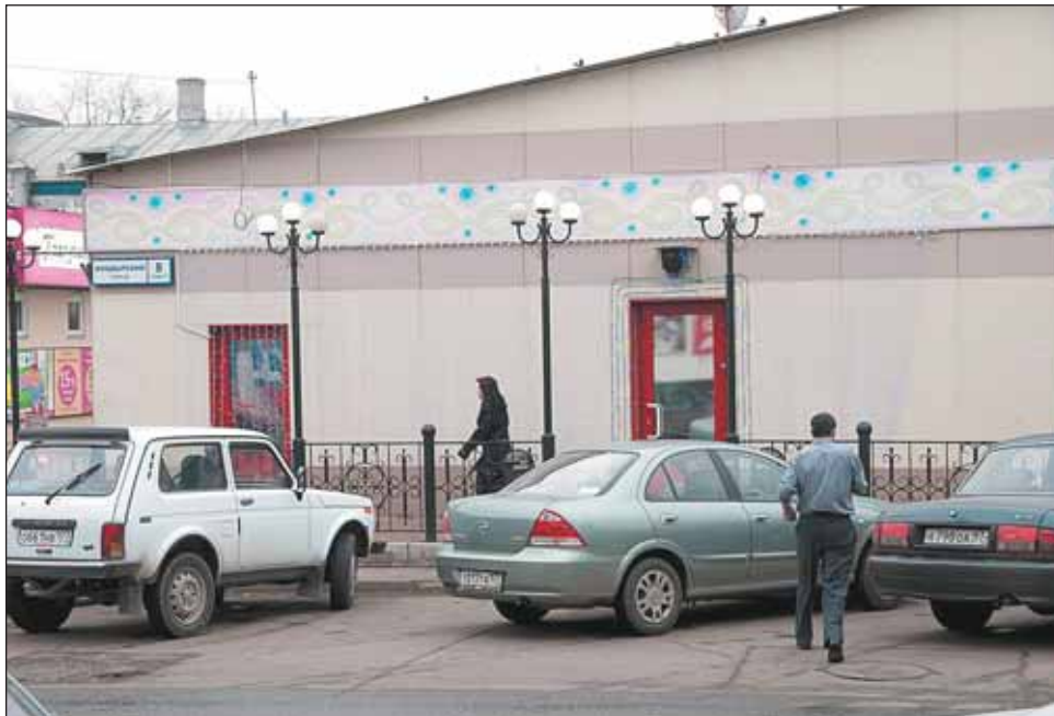
Лотерейные автоматы в торговом центре на Анадырском, 8, работают, увы, на законных основаниях

— На территории района, в том числе и на Анадырском, 8, у станции Лосиноостровская, работают не залы игровых автоматов — их действительно закрыли, — а лотерейные клубы. Деятельность клубов регулирует закон «О лотереях», разрешение выдает Федеральная налоговая служба. Мы, со своей стороны, требуем от владельцев оборудования и организаторов лотереи пакет первичных документов на право деятельности. Об открытии в районе лотерейных