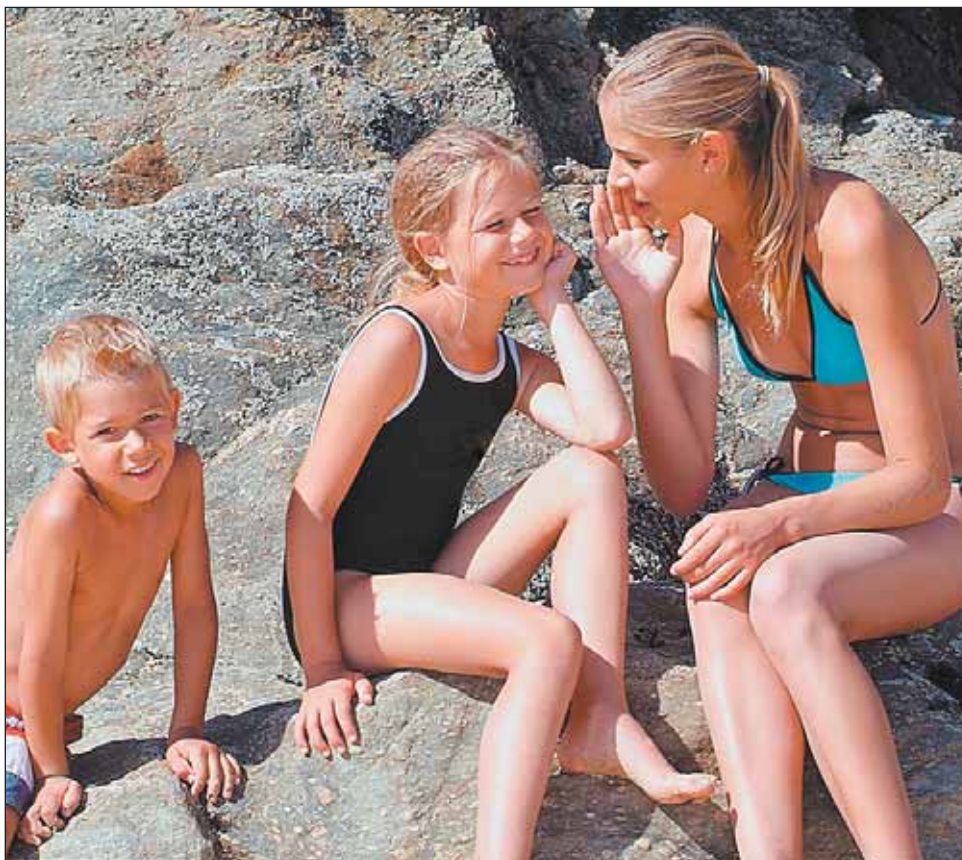
Чтобы дешево поехать к морю, не обязательно быть льготником

И Районная комиссия по организации отдыха и оздоровления детей управы района, тел. (495) 471-4888.