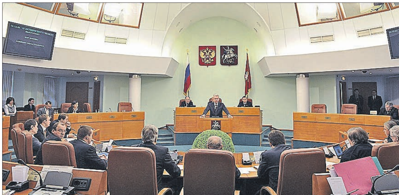
Заседания депутатов Мосгордумы 5-го созыва проходили раз в неделю

В начале 2014 года в истории Мосгордумы начался новый этап. Фракция «Еди-