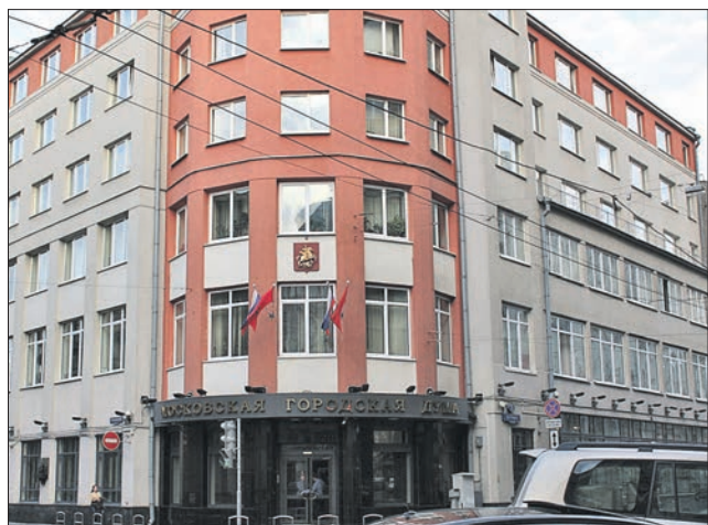
Здание Мосгордумы на Петровке

К исключительной прерогативе Думы относятся