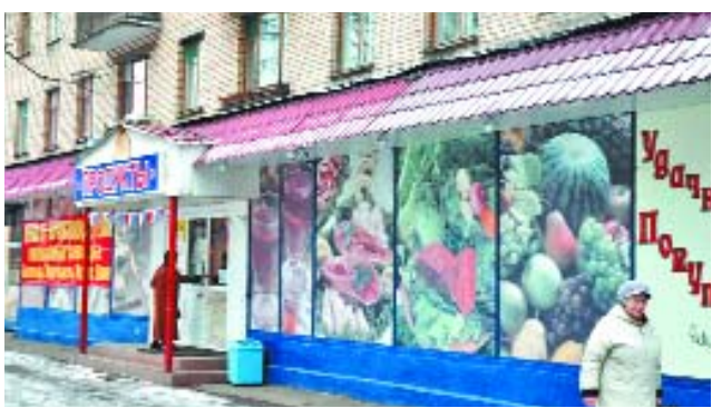
Магазин на Тайнинской, 14, проверили вдоль и поперек, но никакого «криминала» не нашли