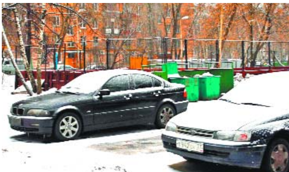
Из-за скопления машин к мусорным бакам на Минусинской, 12, не подъехать

Ситуация, наверное, достаточно типичная для Москвы в целом. И отягощается все это тем, что машины ставят на газон, аккуратно на недавно посаженные деревья, в чем, к своему стыду, грешен и я. А некоторые ос-