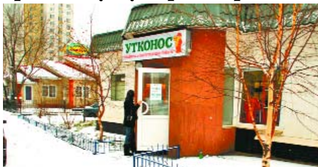
Стартовая, 18. Еще один магазин предварительных заказов