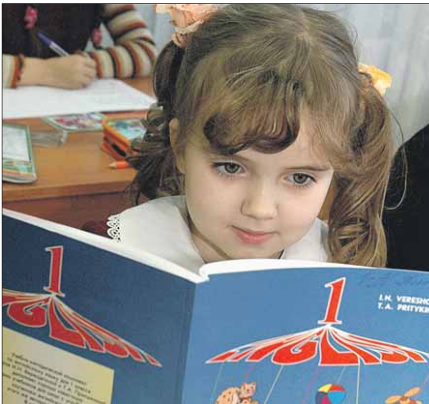
Первоклассники будут учиться только пять дней в неделю

Приняты новые санитарно-эпидемиологические нормы для средних учебных заведений