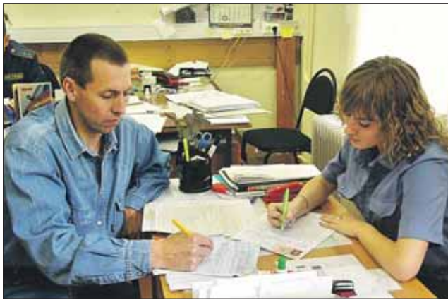
ОГИБДД УВД СВАО на Вешних Водах: «разбор полетов» незадачливого водителя

С другой стороны, по словам инспекторов ГИБДД, количество многих нарушений, в том числе грубых, действительно снизилось. Например, гораздо реже водители стали превышать скорость. Также стало заметно меньше не пропускающих пешеходов на «зебре»: по сравнению с прошлым годом число таких случаев