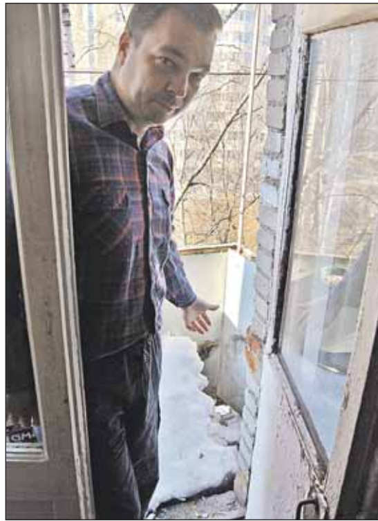
Соседи ниже жалуются, что на них падают обломки