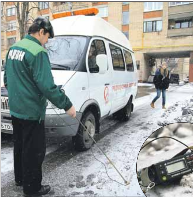
Если прибор в машине показывает 10 микрорентген, выходит специалист и проводит проверку дозиметром

Едем медленно, иначе прибор не успеет провести