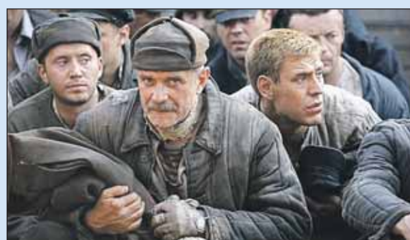
Фильм «Утомленные солнцем-2» многие не поняли потому, что все сюжетные ходы завершатся в последней ленте трилогии — «Цитадель»