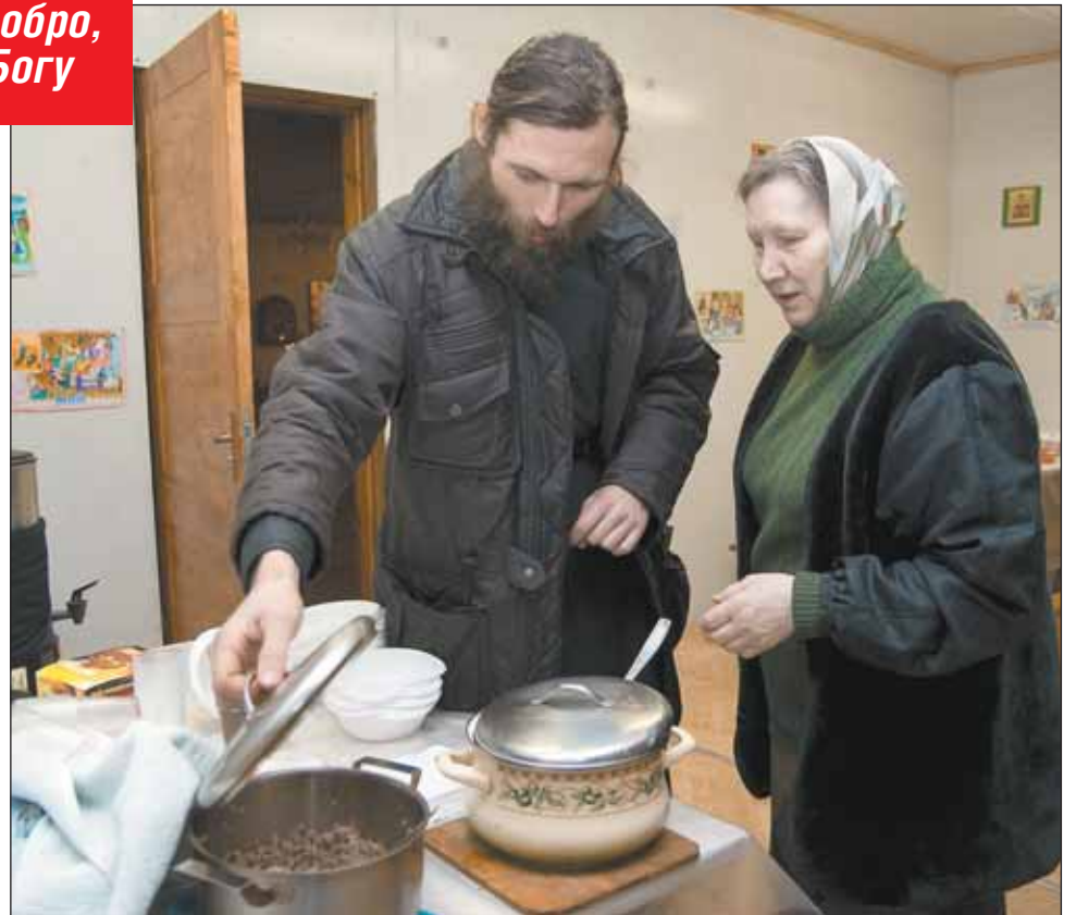
Благотворительные обеды готовят в храме Сергия Радонежского в Бибиреве

— Мы хотим сделать социальное служение в благочинии более системным. Пой-