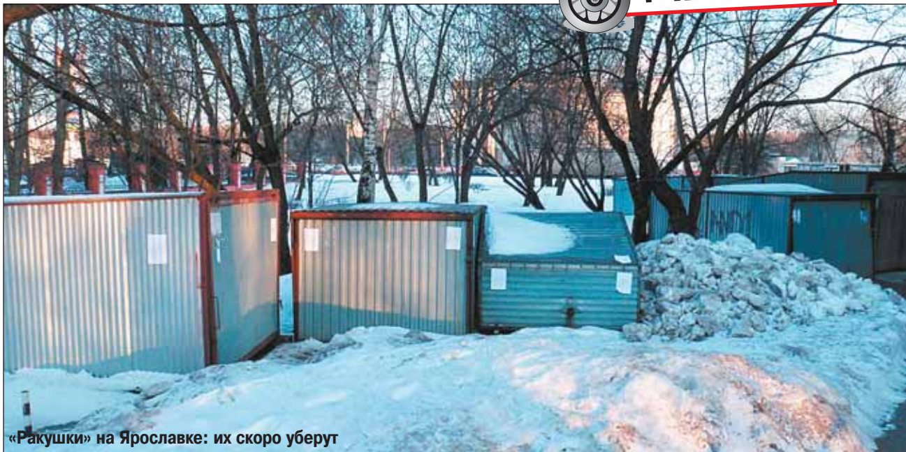
«Ракушки» на Ярославке: их скоро уберут