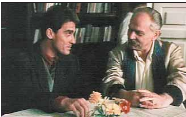
Кадр из фильма «Белые одежды»