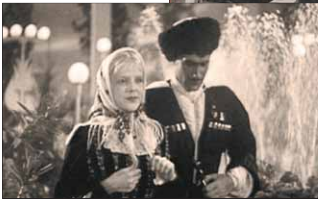
Фильм «Свинарка и пастух» снимался в первые месяцы войны

новлены зенитные батареи. Выставка стала объектом противовоздушной обороны, поэтому за всю Великую Отечественную на ее территорию не упало ни одной бомбы.