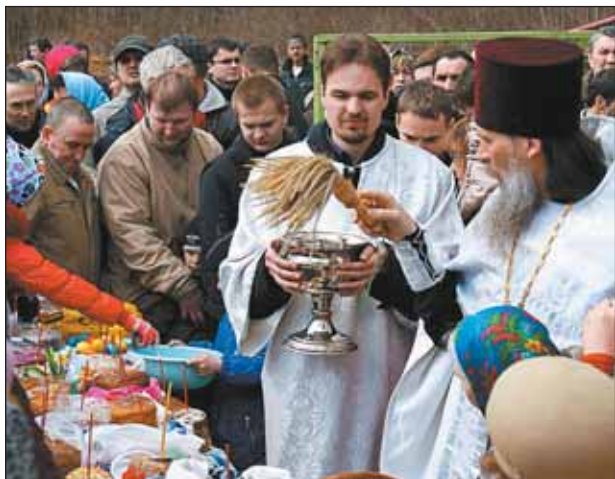
Освящение куличей и яиц в храме Успения Пресвятой Богородицы в Северном