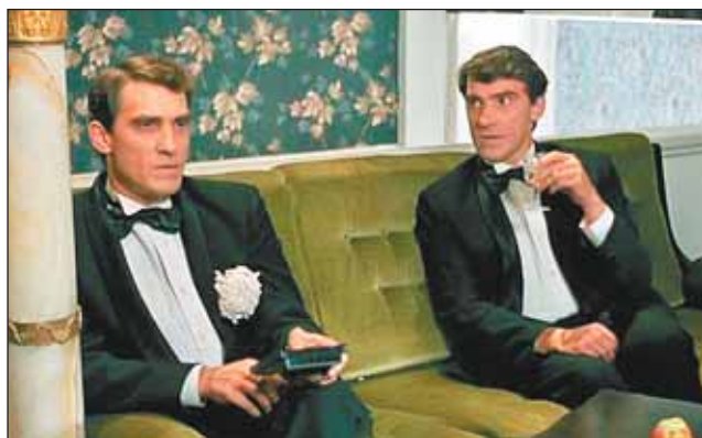
Кадр из фильма «Ширли-Мырли»