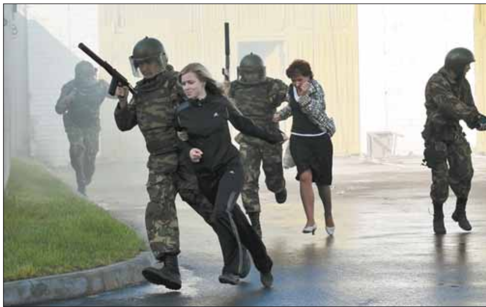
А непосредственную защиту осуществляют спецназовцы

сударству в 100 тысяч рублей ежемесячно.