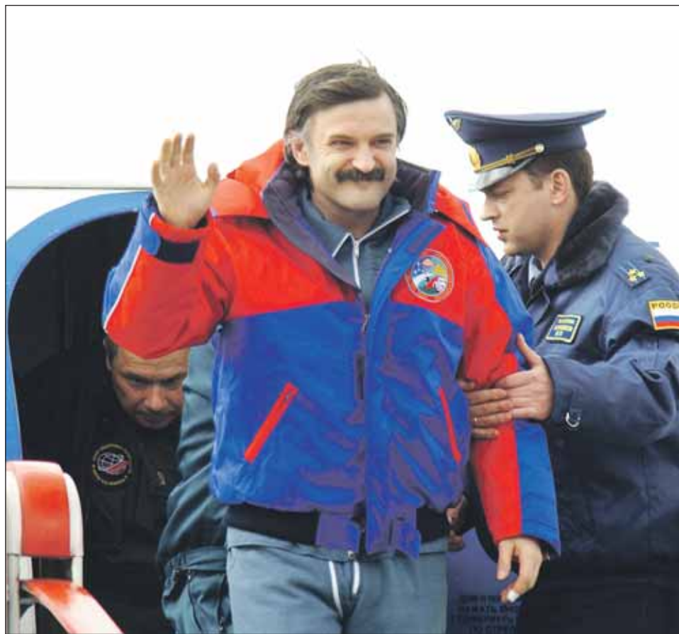
«Вот я и дома!»

— Как угодно — стоя, лежа — в любой позе. Там пространство не имеет опоры, и ты просто плаваешь. Кроме того, в невесомости отсутствует естественная конвекция, когда теплый воздух