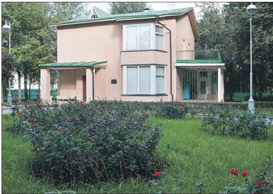
Сергея Королева поселили на бывшей даче Калинина

О станкино уже давно стало синонимом телевидения. Но еще этот московский район называют «космическим». И не случайно. Здесь разросся целый «куст» улиц, в именах которых — вся история освоения внеземного пространства. На 1-й Останкинской улице сохранился дом, где жил академик Сергей Королев. А на Хованской разбит целый городок космонавтов. Около метро «ВДНХ» установлен памятник Покорителям космоса, а в его основании открыт Мемориальный музей космонавтики, тут же Аллея Космонавтов. Есть кинотеатр «Космос» и одноименная гостиница, рядом — гостиница «Звездная». На территории района находятся научные предприятия, работающие на космос. Но почему именно этот район стал «космическим»?