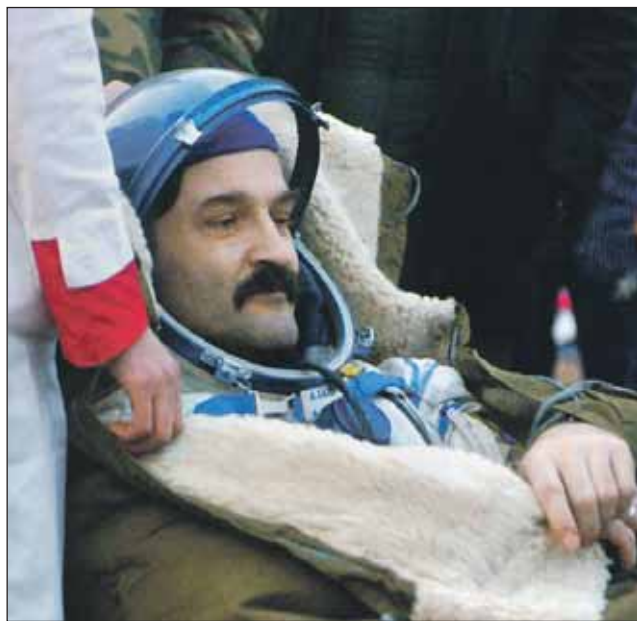
Вскоре после приземления

— Все так же, как и на Земле: пять рабочих дней и два выходных. В выходные можно поспать подольше и живем мы по вольному графику. Рабочий день длится шесть с половиной часов, и обязательно два с половиной часа — физкультура для профилактики. Смысл вот в чем. На Земле мускулатура человека работает иначе. Даже если мы ничего не делаем, например просто сидим в кресле, тело совершает механическую работу и мышцы напряжены. В невесомости этого нет, мышцы всегда расслаблены. Поэтому там хочешь не хочешь приходится два с половиной часа в день заниматься физкультурой, чтобы как-то нагрузить мышцы. Плюс прием пищи, плюс личное время, плюс на сон 9 часов. Так сутки и складываются.