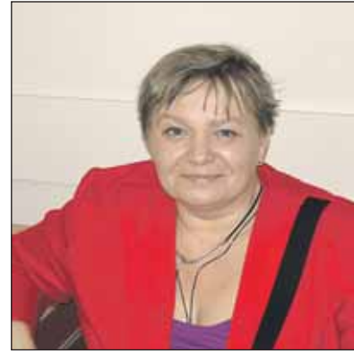
Если эти дамы «корректировали» вашу судьбу, позвоните в милицию