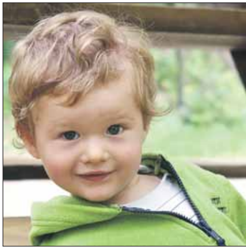
Дорогие читатели! Присылайте нам фотографии своих детей и интересные истории о них: 129090, г. Москва, просп. Мира, 18, pochta@zbulvar.ru