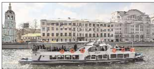
Теперь до осени будут курсировать 47 прогулочных теплоходов