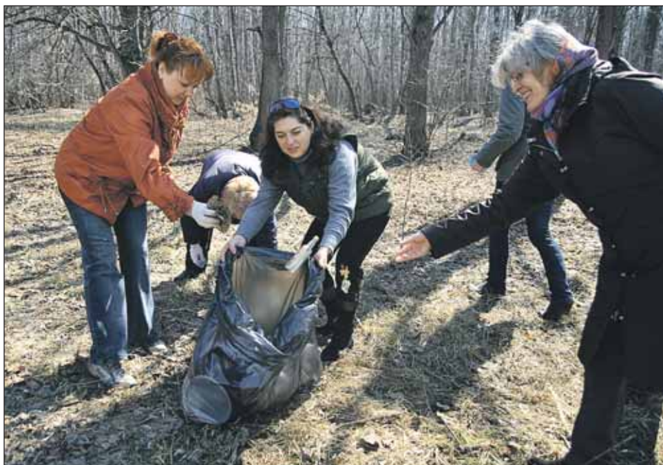
Уборка мусора в Лосином Острове

Кто-то с граблями собирал оставшиеся после зимы сучья и листья, кто-то подметал терренкуры. Другие склады-