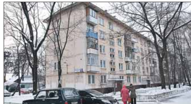
178 жителей дома 29, корпус 2, на улице Лётчика Бабушкина (серия 1-МГ-300, год постройки — 1964) должны переехать в новые квартиры весной-летом 2014 года

И С детальным планом сноса пятиэтажек сносимых серий можно ознакомиться на сайте префектуры svao.mos.ru (раздел «Строительство»)