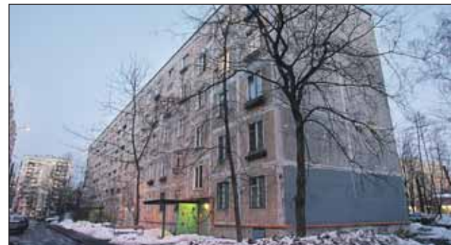
Переезд 122 жителей пятиэтажки без балконов на Дежнёва, 8 (серия К-1, построена 48 лет назад), ожидается в конце лета 2014-го