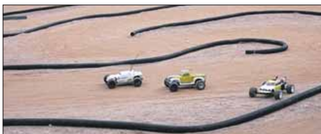
Почти как настоящие, только в 10 раз меньше

беда. В «Лидере» совершенно бесплатно помогут собрать автомобиль. Более того, сделают ему, как говорят автолюбители, тюнинг: усилят некоторые элементы конструкции, подберут другие колёса и пр.