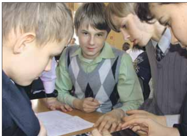
В финал вышли 12 команд

По итогам игр первенствовала команда одиннадцатиклассников из лианозо-