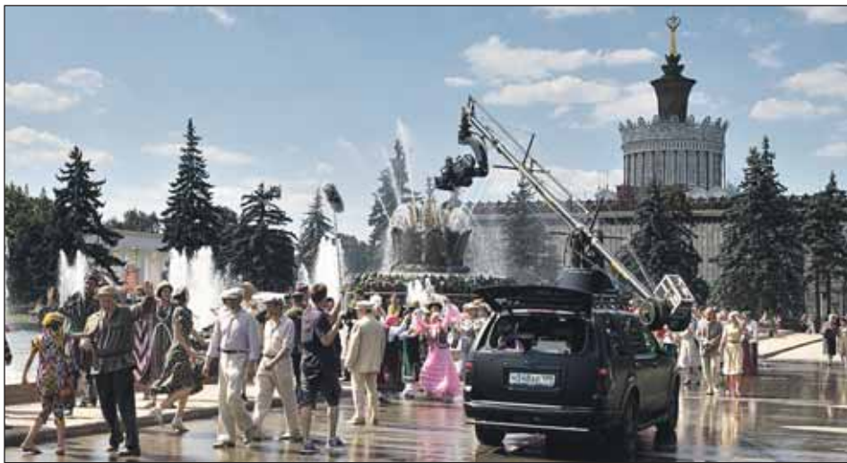
Некоторые сцены фильма снимали на ВВЦ

— Как вы решились доверить экранизацию начинающему режиссёру?