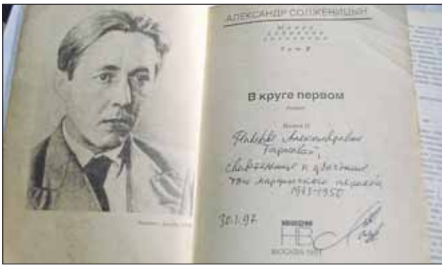
Книга с автографом писателя

Бывший студент математического факультета Ростовского университета Александр Солженицын входил в состав группы №3, задачей которой было дать математическое решение шифрованию речи. Работа группы была признана неудачной, её расформировали, и Солженицына перевели в акустическую лабораторию. Здесь