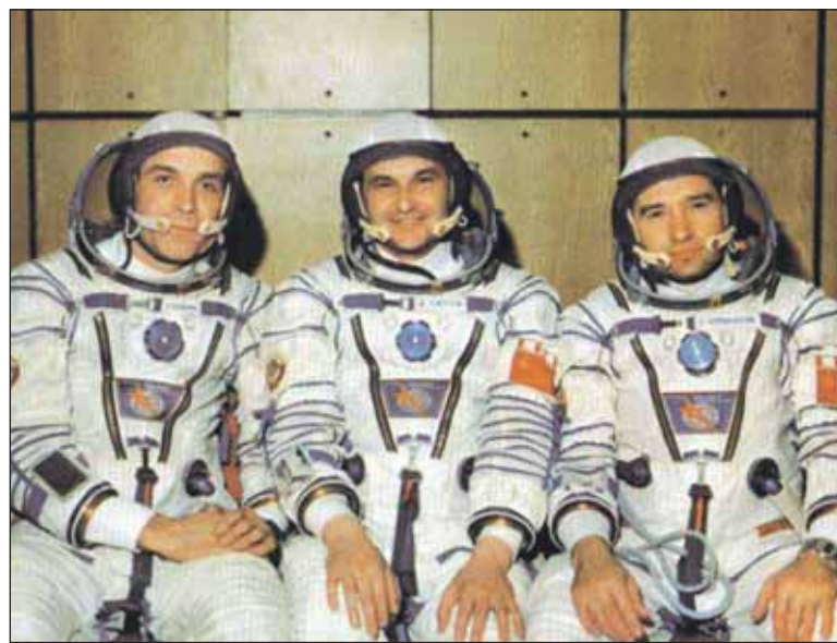
Экипаж корабля «Союз Т-8»: А.А.Серебров, В.Г.Титов и Г.М.Стрекалов

сразу 5 выходов из-за производственной необходимости. Три — по дооснащению станции наружным оборудованием: нужно было установить звёздные датчики и телекамеру, ещё один — для испытания новых скафандров, и 2 раза испытывали космический мотоцикл. Космический мотоцикл — это средство для перемещения космонавта в открытом космосе. Немного похоже на кресло. Надеваешь на себя здоровенный ранец,