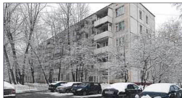
58-квартирному дому на улице Годовикова, 10, корпус 1 (серия 1605-АМ, построен в 1962 году), стоять ещё 4 года — до осени 2016-го