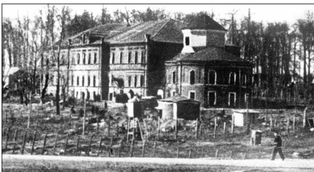
«Марфинская шарашка». Конец 1940-х

Но молчать в течение всего трудового дня невозможно, тем более что молодые специалисты, только что вышедшие из института, ниче-