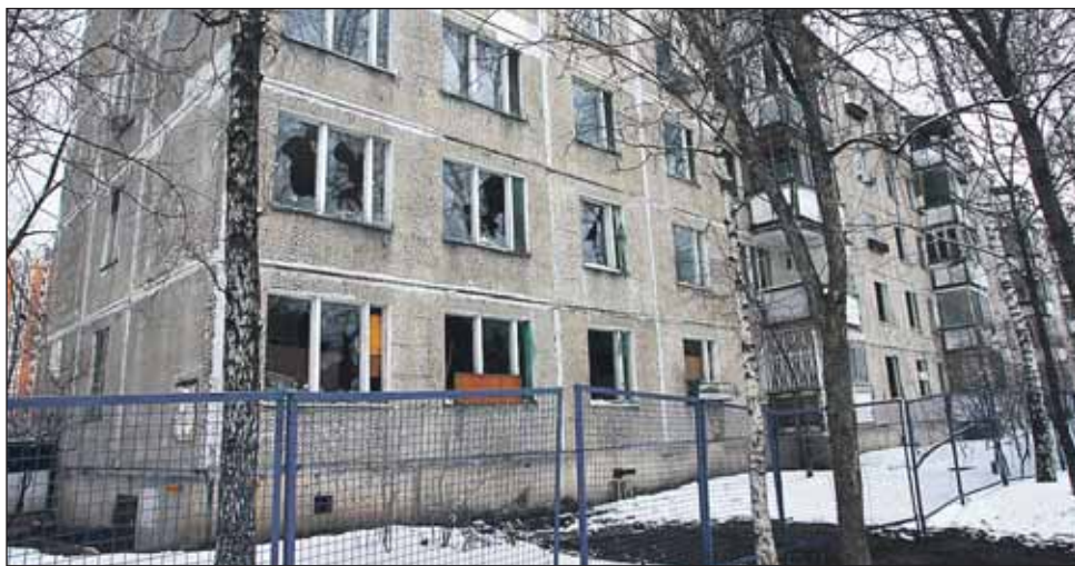
На Грекова, 22, отселили и начинают сносить 7-подъездную пятиэтажку со спаренными балконами (серия 1-МГ-300, год постройки — 1968)

Следующими станут пятиэтажки на Грекова, 14 и 16, и Стандартной, 27, где пока нет генподрядчика, но, думаю, в течение апреля он бу-