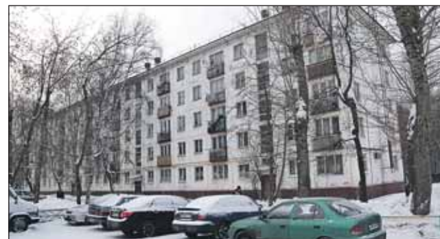
Дому 41, корпус 2, на улице Лётчика Бабушкина, с балконами на столбиках-подпорках (серия II-32), исполнилось 53 года. Снос намечен на II квартал 2014 года