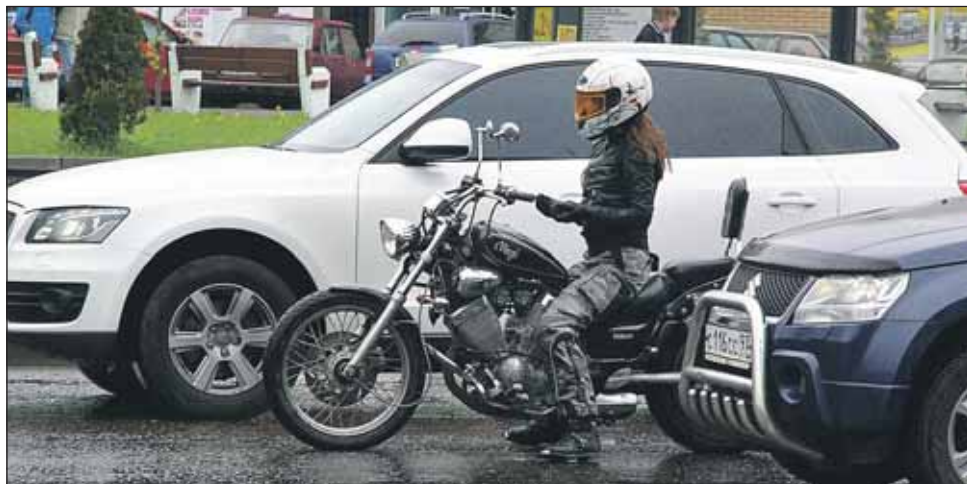
В «Книге памяти» на сайте moto.ru много тех, для кого первая же поездка на первом в жизни мотоцикле стала последней. Есть среди них и девушки

Многие относятся к этому легкомысленно: сначала куп-