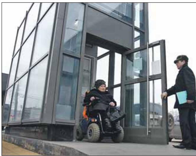
Въехать в лифт и выехать самостоятельно инвалиду-колясочнику практически невозможно

Затем префект осмотрел два подъёмника, которые не-