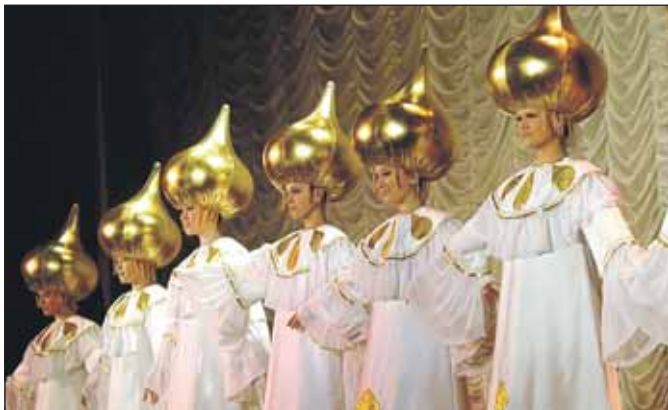
Выступление «Задоринки» на фестивале

Детский ансамбль народного танца «Задоринка» из Лосиноостровского района занял первое место на московском фестивале городских коллективов «Россия начинается с тебя». В награду он получил звание «народный».