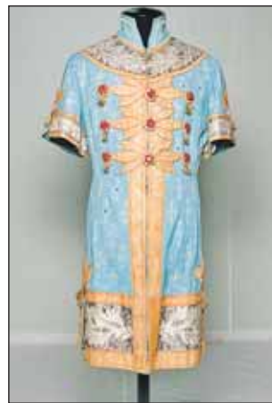
А это тот самый царский сарафан, в который в финале сказки облачался Иванушка