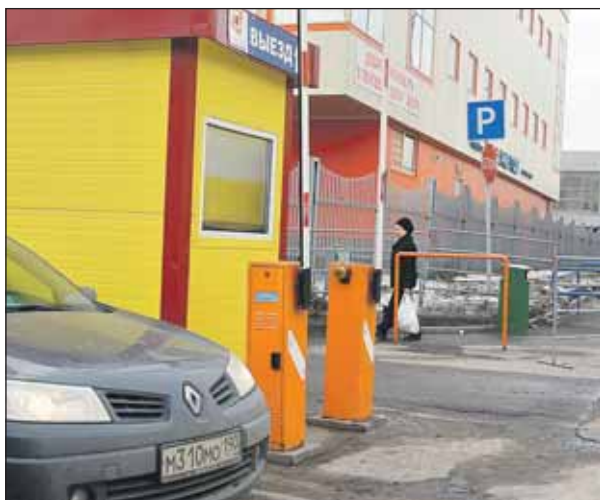
Прикрепите специальный знак, и перед вами откроют шлагбаум