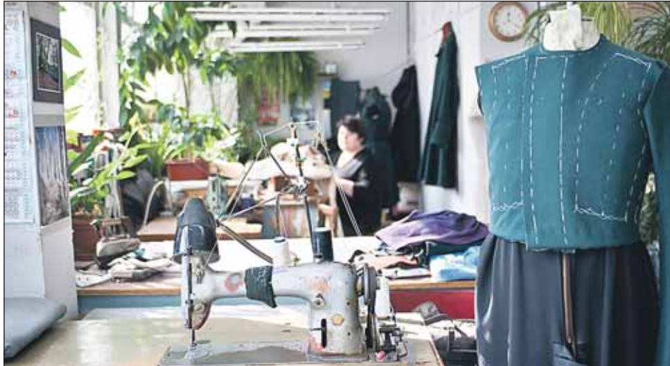
Здесь сошьют костюм для любой эпохи

В павильонах и фондах Киностудии им. Горького корреспондент «ЗБ» обнаружил немало любопытного