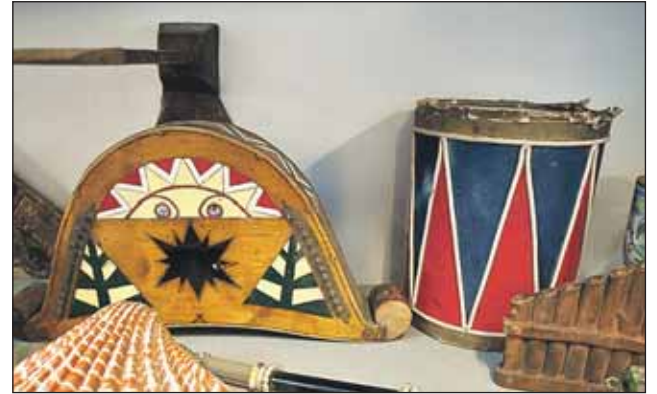
Узнаёте? Гусли и барабан из фильма «Марья-искусница»

А рядом — мрачная нацистская форма. Кажется, из «Семнадцати мгновений весны». Или нет? Богатства фонда ещё только предстоит систематизировать.