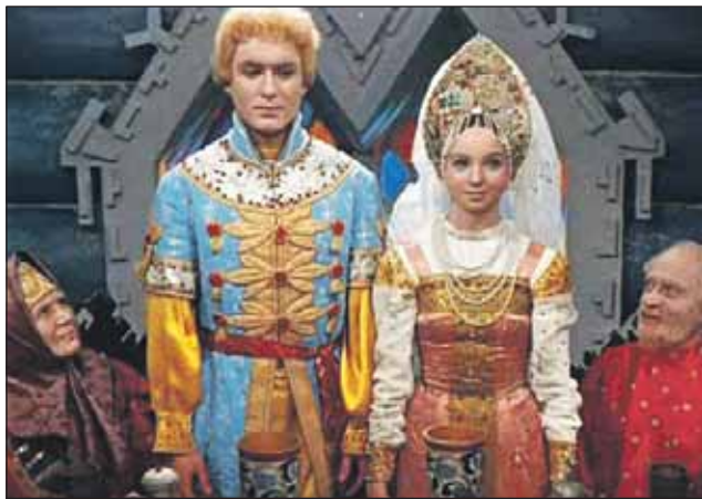
Кадр из фильма «Морозко»

Разросшийся пристройка-ми особняк киностудии вну-