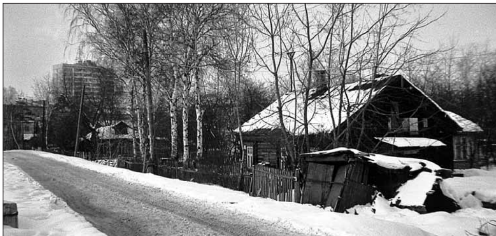
Один из Ватутинских переулков в старой Лосинке