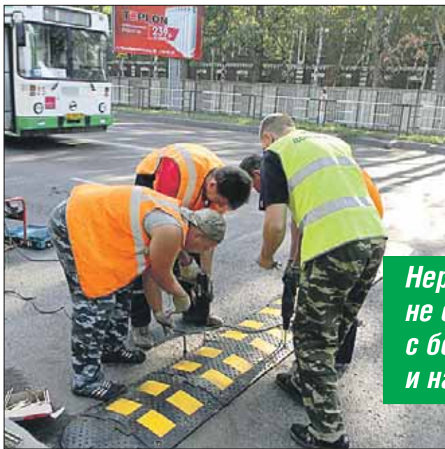
Оборудование наборной неровности стоит 100 тысяч рублей

С просьбой об установке искусственной неровности нужно обращаться в управу района по месту предполагаемой установки. Но их нельзя поставить где угодно. По действующим в Москве нормам неровности могут быть установлены на улицах районного и местного значения, боковых и местных проездах, перед детскими учреждениями, местами массового отдыха и другими объектами, у которых обычно много пешеходов, а также перед опасными участками дорог, где скорость ограничена до 40 км/ч и ниже.