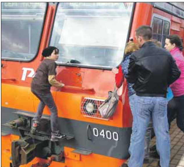
Всего за час с поездов сняли 5 подростков

вы это делаете? Отвечали одинаково: уговорили друзья, рассказывали, как это прикольно. Но прилив адреналина (и это тоже общее мнение) был только в первый раз, а потом оказалось не так клёво, как думали. Зачем же продолжать? Ответ и тут был одинаков: нечем заняться.