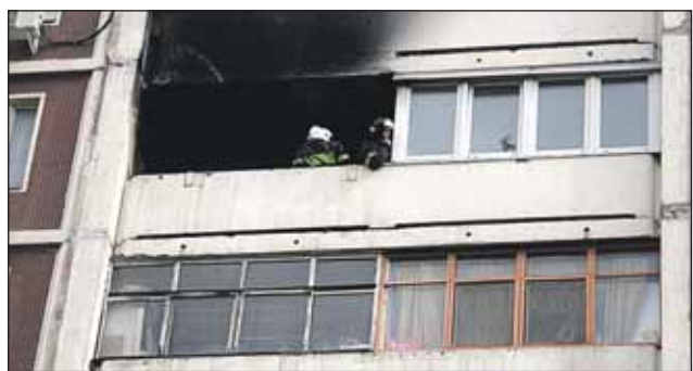
Алтуфьевское шоссе, 78