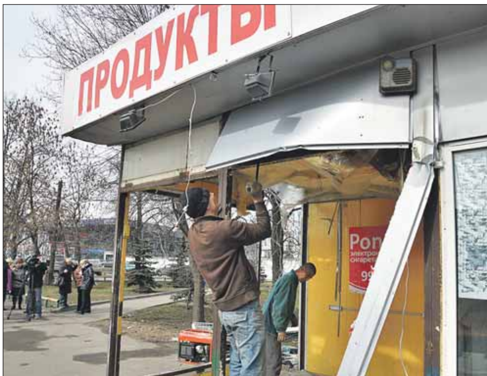
Демонтаж павильона на Ярославском шоссе, 49

ные объекты не вошли в Схему размещения объектов мелкорозничной торговли, которая была утверждена на уровне города ещё в прошлом году. Тогда же с владельцами этих павильонов город расторг договоры аренды