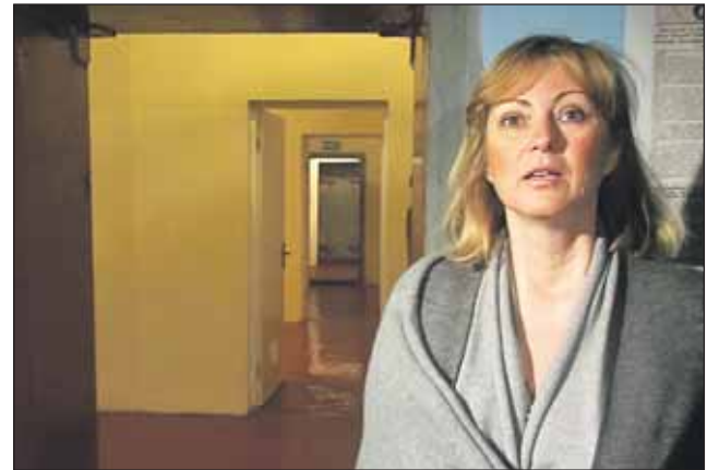
Экскурсовод расскажет о тайном бункере для генсеков

К 29 апреля экскурсионное бюро ВВЦ подготовило 5 новых маршрутов: «Легенды и мифы ВДНХ», «Вечерняя прогулка по ВВЦ», «Сердце «Каменного цветка», «Зелёный наряд и ландшафт-