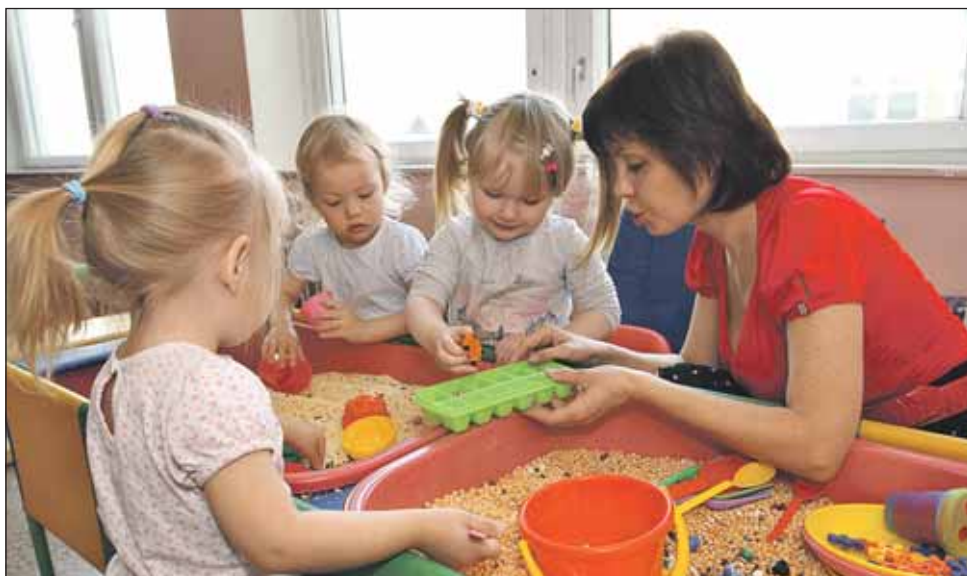
В ЦИПР можно записать ребёнка от годика до трёх