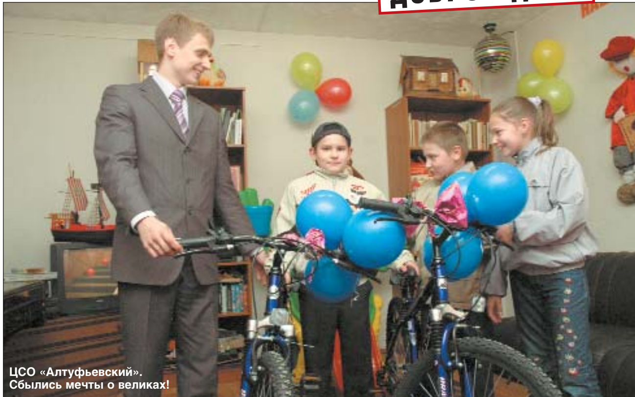
ЦСО «Алтүфьевский». Сбылись мечты о великах!