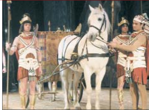
были «Волкодав», «Слуга государев» и знаменитая реклама пива — именно Снежок въезжает в офис, в котором «конь не валялся».

Актерская карьера Снежка началась несколько лет назад, с участия в съемках масштабного проекта Светланы Дружининой «Виват, Анна Иоанновна!». Потом