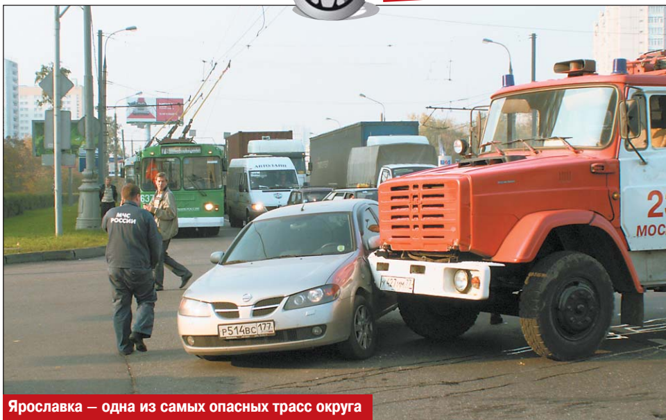
Ярославка — одна из самых опасных трасс округа

На 19-м километре недавно сделан отдельный карман для автомобилей, поворачивающих на Долгопрудненское шоссе, и выделена для них специальная фаза в работе светофора.