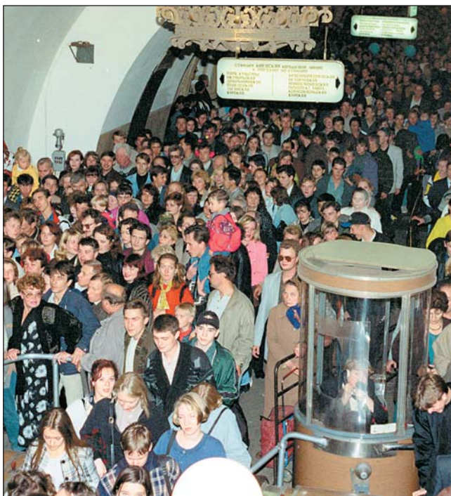
Станция метро «Киевская» в часы пик

Когда поезд останавливается в тоннеле, большинство пассажиров хотя бы ненадолго отрываются от привычных занятий и осматриваются, и лишь небольшая часть людей с железными нервами никак не реагируют, продолжая сидеть неподвижно, уткнувшись в