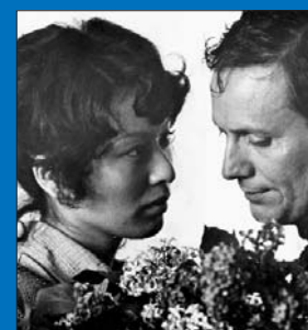
«Мелодии белой ночи»