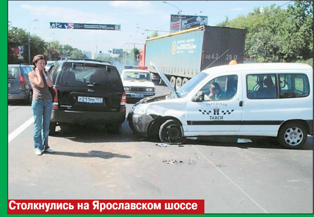
Столкнулись на Ярославском шоссе