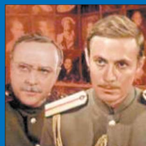
«Адьютант его превосходительства»