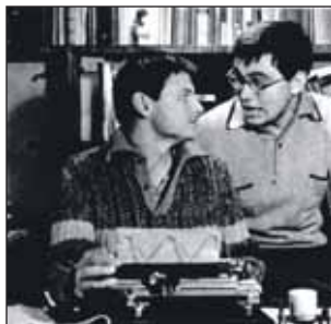
Тарковский и Кончаловский в молодые годы