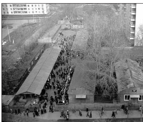
ностях, баловали горожан парным молоком и дарами своих огородов.

Почти за 20 лет до возникновения больших торговых центров люди покупали здесь всё необходимое. Жители деревень, остатки которых ещё сохранялись в окрест-