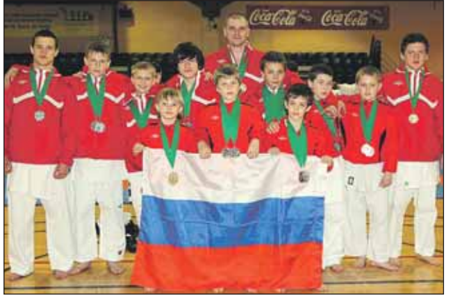
В Дублине лианозовцам равных не было