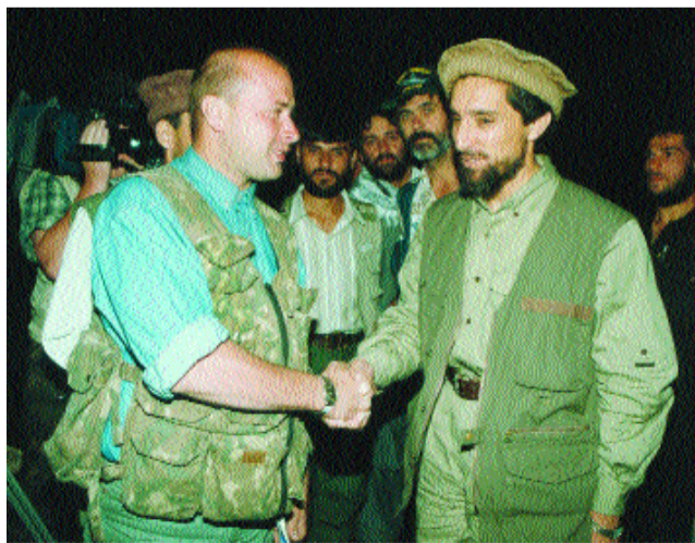
Афганистан. С Ахмад Шах Масудом.