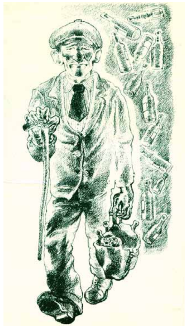
Собирателъ бутылок. 1965 г.