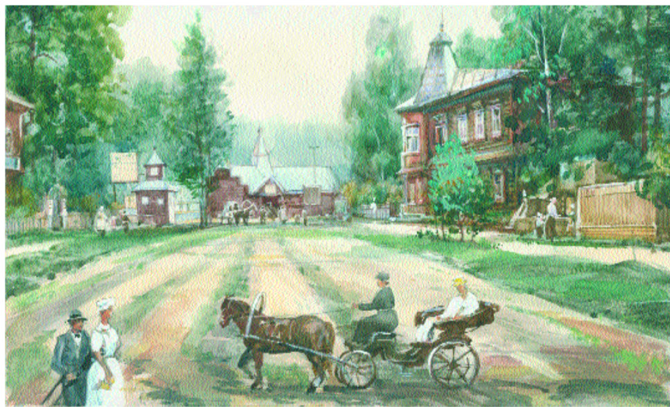
Лосинка. 1912 г. Дорога к вокзалу

ма со Львом Толстым, и спросить ее, каков был гений в жизни. В булочную на Рудневой частенько заглядывал известный коллекционер живописи Вишневецкий, брат знаменитого медика (помните — мазь Вишневецкого?).