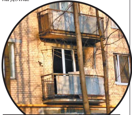
Квартира на Снежной выгорела дотла

Спасаясь, парень оставил дверь квартиры открытой, и подъезд моментально затянуло дымом. Пожилая жительница 5-го этажа отравилась угарным газом и была госпитализирована, а прибывшие пожарные только и успевали снимать с балконов перепуганных людей. Предполагаемый виновник пожара был также отправлен в больницу. А его квартира сгорела дотла.