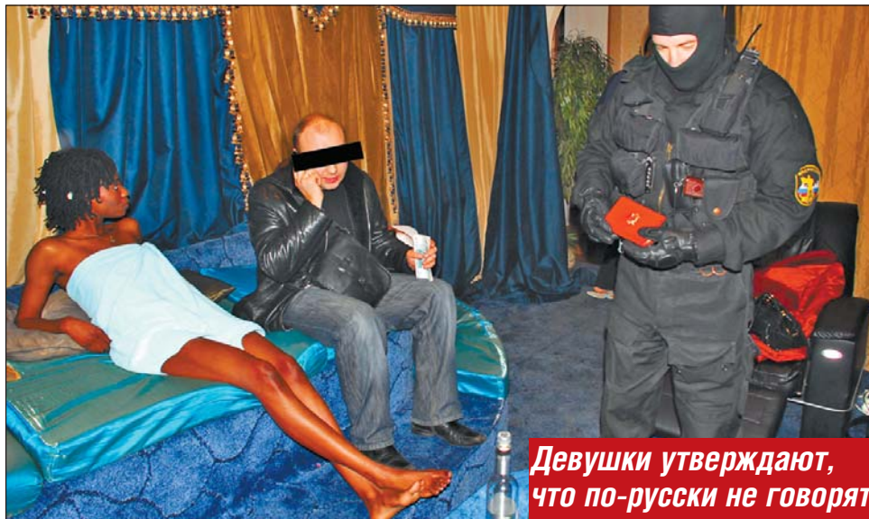
Девушки утверждают, что по-русски не говорят

14 января, вечер. Мы в доме 17 по Ярославской улице, в здании гостиницы «Глобус», где расположена VIP-сауна. Деньги за «товар» получены, сутенер обезврежен. Теперь и нам с фотографом можно пойти на место происшествия. В коридоре сауны обмениваются шутками оперативники в исподнем, у стены горько вздыхает завернувшая в махровое полотенце чернокожая красавица. В самой сауне на столе разложены изъятые документы, толпятся понятые и сотрудники милиции. На полу у стены лежит скованный наручниками солидный габаритов чернокожий сутенер: на пальце у него красуется забрызганный кровью перстень с крупными бриллиантами, с черной шеи свисает мас-