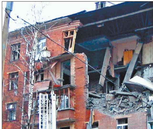
Декабрь 2005-го. Страшные последствия взрыва на Годовикова, 4

Может, с точки зрения эстетики это не очень привлекательно, но улица не дом, на воздух не взлетит. Газовые трубы, расположенные в межстенных и межэтажных перекрытиях, регулярно