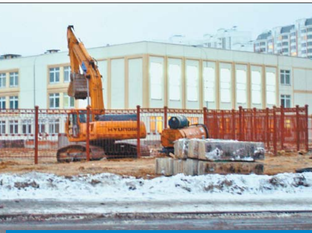
Новая школа в Северном будет сдана к сентябрю

Осуществить в полном объеме строительство городских инженерных сетей и сооружений для обеспечения ввода жилых домов, в том числе в районах Северный, Северное и Южное Медведково.