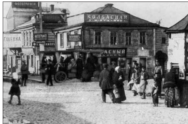
Так выглядела Марьиная Роща более века назад