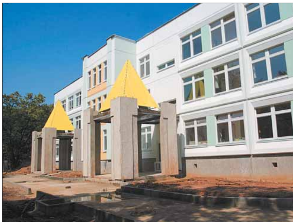
Новый детский сад на Малой Ботанической, 14а