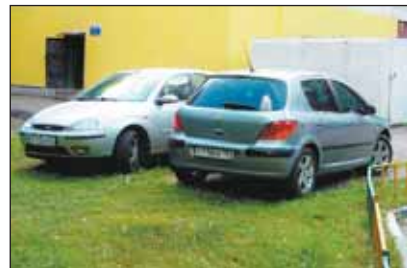
3-я Новоостанкинская, 2. Машины портят газоны у дома

Всего инспекторы обнаружили 842 нарушения разного характера. Более 700 были устранены непосредственно в ходе