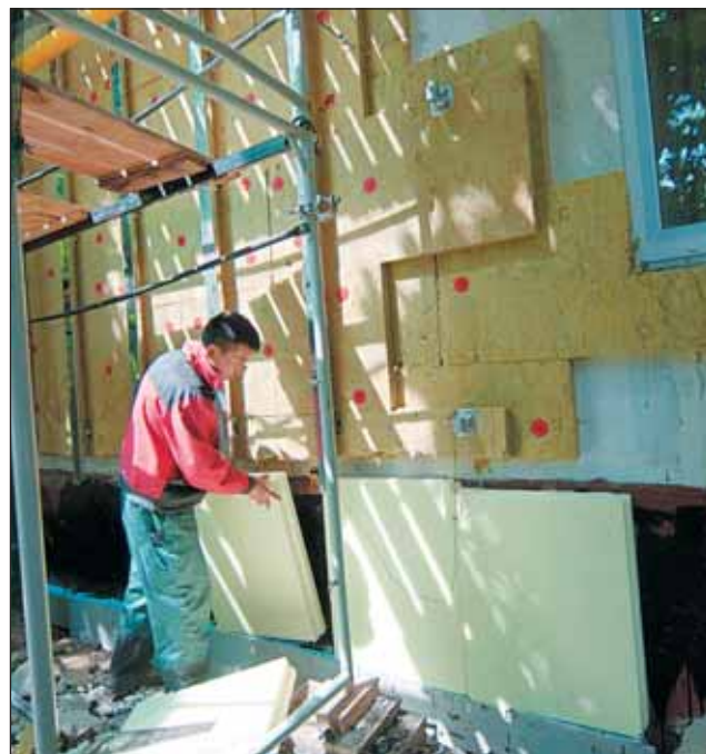
На Студеном, 18, утепляют фасады

Одновременно с капитальным ремонтом по программе 2009 года город завершает работы в домах, где в 2008 году провели выборочный капремонт. В 55 из 181 дома прошлого года установили новые окна, продолжается утепление фасадов и остекление балконов. Но из-за кризиса часть работ придется перенести на следующий