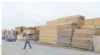
Для крупногабаритных товаров можно нанять машину из службы доставки ярмарки