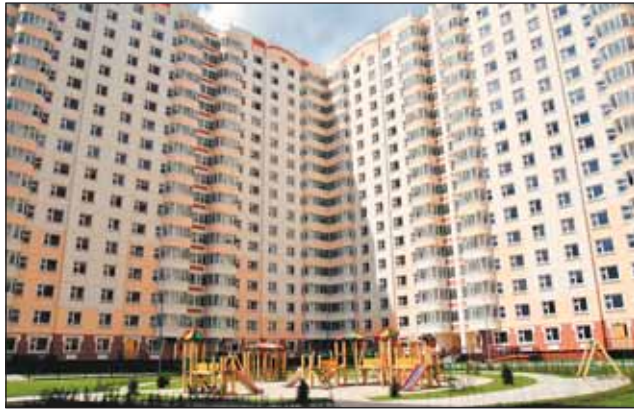
Новостройки района Марфино

Всего на территории бывшего агропредприятия (микрорайон 51-52) должно быть построено 18 домов. На первых этажах разместятся досу-