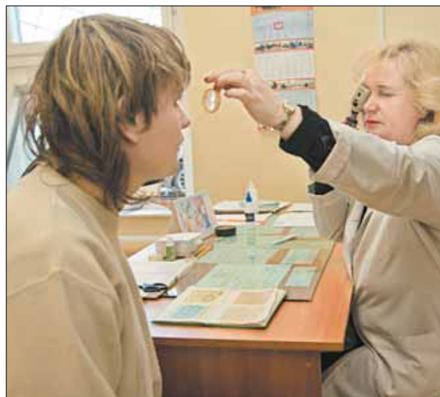
Патологию глаз у больных СВАО выявляют все чаще на ранней стадии

На диспансерном учете находятся больные, страдающие глаукомой, осложненной близорукостью высокой степени, заболеваниями сетчатки и зрительного нерва, диабетической ретинопатией, а также инвалиды по зре-