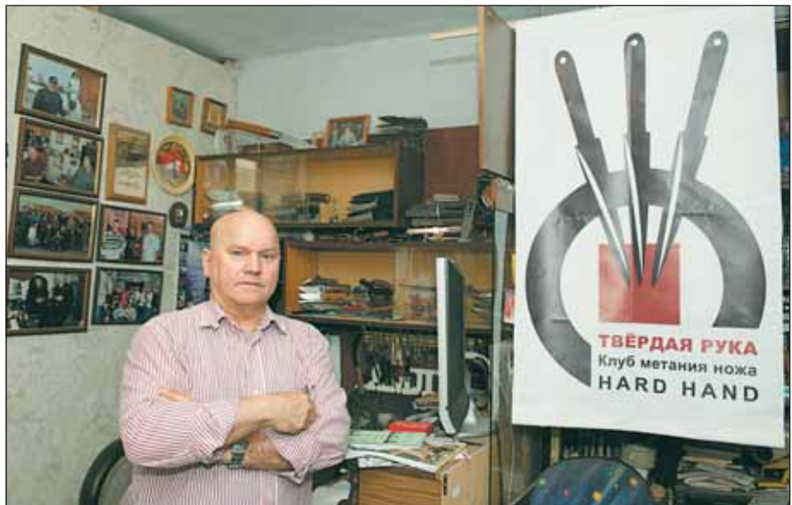
Мастер делает клинки только на заказ