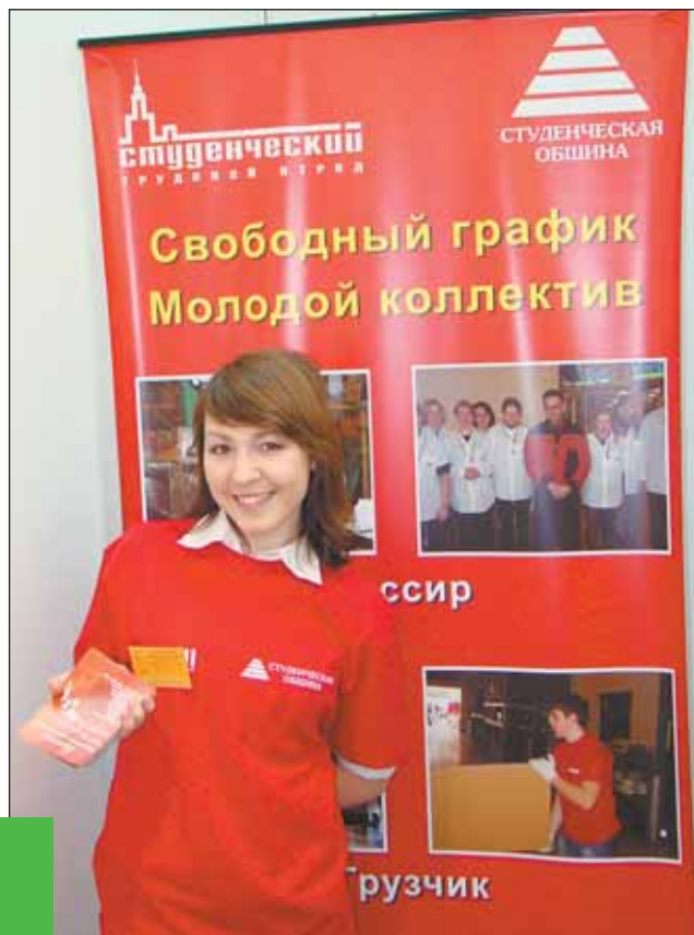
В Студенческой общине полагают, что осенью цена рабочих рук повысится

Еще один из вариантов подработать — устроиться в строительный отряд. В этом году студенческим стройотрядам выделили объекты для строительства и ремонта в Москве. Ближе к сентябрю та-