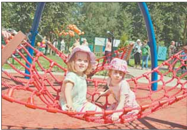
Аттракционы отлично показали себя и в 30-градусную жару

На пересечении улиц Изумрудная и Минусинская в Лосиноостровском районе открылась первая в округе игровая площадка для детей-инвалидов. Качели, лабиринты, игровые столы — все сделано с учетом особенностей ребят. Например, баскетбольное кольцо больше похоже на трубу: мяч, падая сверху, скатывается, как по водостоку, прямо в руки юному спортсмену в инвалидной коляске. Дизайнеры разрабатывали проект под руководством врачей и психологов. Площадка подходит как инвалидам, так и обычным де-