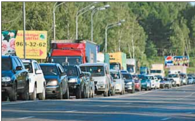
Дублером Ленинградки в эти дни стало Дмитровское шоссе

Но для этого нужно, чтобы и граждане проявили высокую сознательность — оказали максимальное содействие переписчикам. Мы-то все, что нужно, организуем. А вот как быть, если человек в квартиру не пускает? Сейчас у нас люди стали замкнутые, далеко не каждый готов распахнуть дверь перед переписчиком, хотя тот имеет удостоверение, инструкции, специальную форму... Вот в чем главная задача.