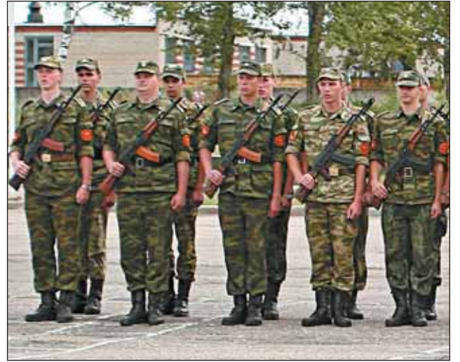
Большинство новобранцев уже приняли присягу

Кстати, на сегодняшний день в войска отправлено уже более 95% юношей от числа