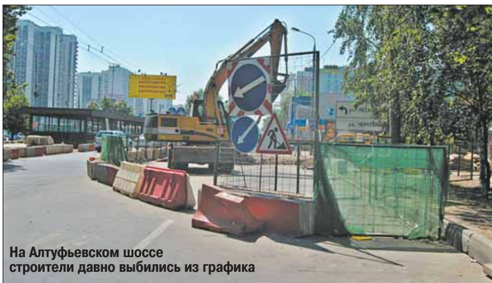
На Алтуфьевском шоссе строители давно выбились из графика

Объезжать Ботаническую через Огородный проезд, а тем более через проспект Мира вряд ли есть смысл: слишком большой крюк. Но дополнительное время на поездку заложить нужно.