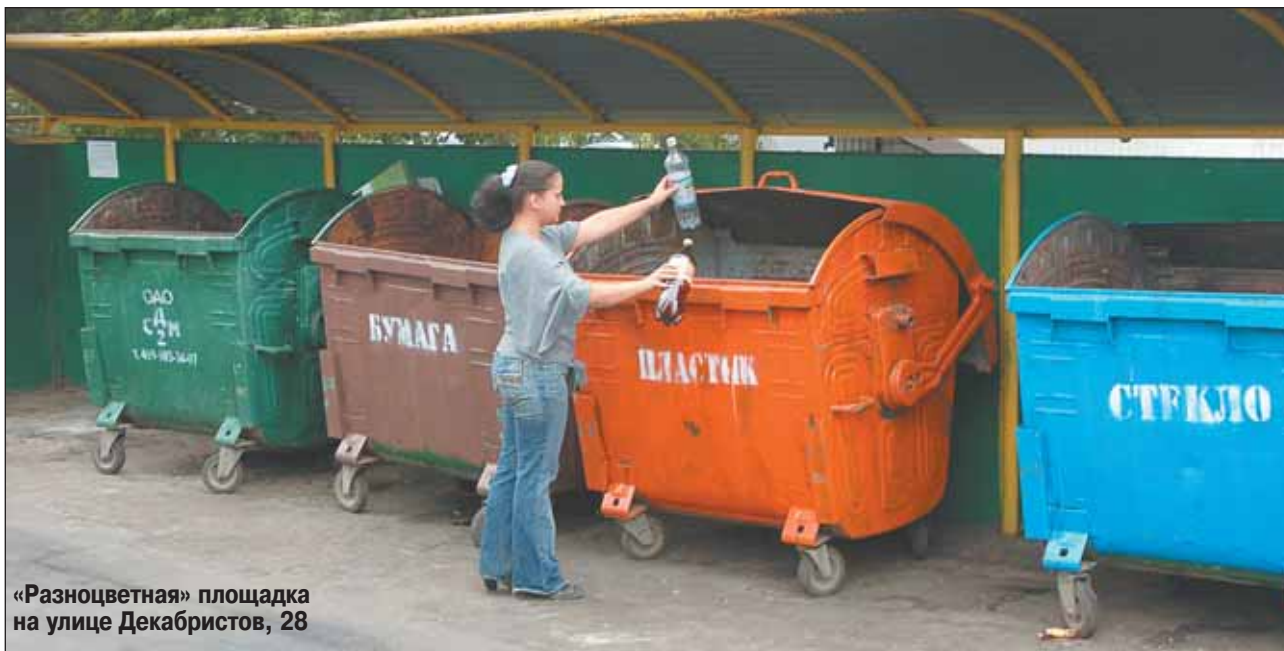
«Разноцветная» площадка на улице Декабристов, 28

В округе занялись селективным сбором мусора