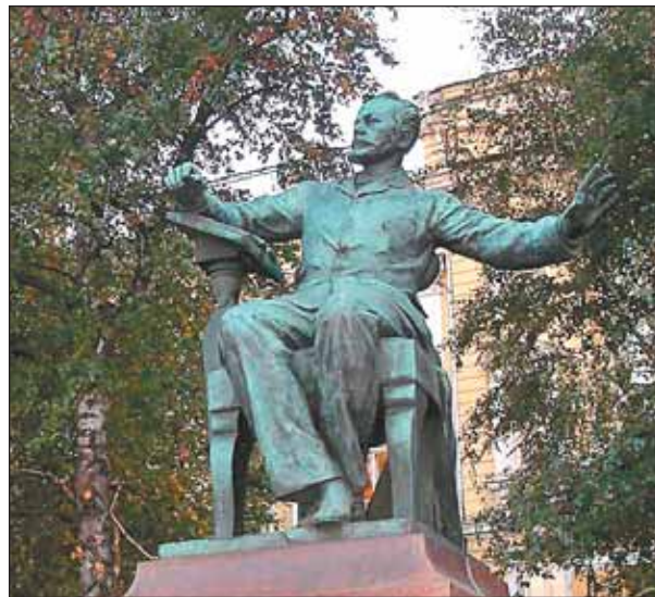
Памятник П.И. Чайковскому работы В. Мухиной у здания консерватории