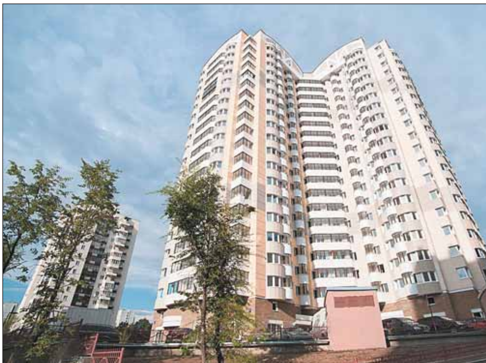
Новый дом по ул. Новгородской, 5, корп. 2, построен по индивидуальному проекту

— Уже сегодня строители активно работают над созданием задела на будущий год, — рассказывает Игорь Маренов. — Например, в Южном Медведково группа компаний ПИК сооружает два корпуса, ввод которых запланирован на 2011 год. Они дадут возможность продолжить расселение жителей пятиэтажек в Южном Медведково (там осталось еще 38 хрущевок сносимых серий).