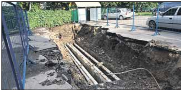
Разрытие на улице Декабристов, 11, в сторону Северного бульвара

Адреса, где будут рыть, — на сайте «ЗБ» www.zbulvar.ru