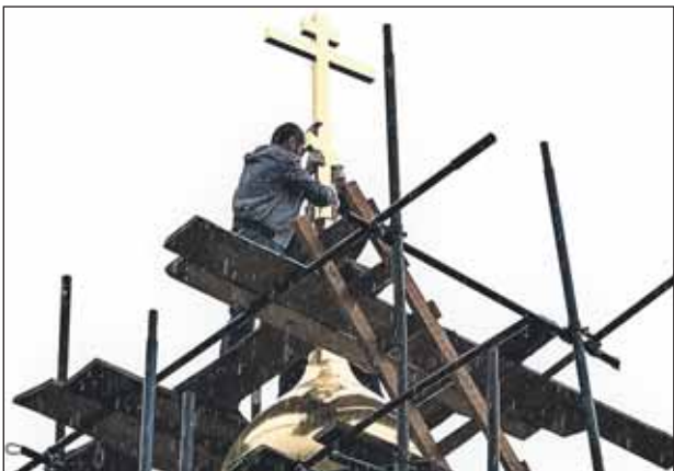
Идёт установка креста

Новый храм построен в традициях шатровой архитектуры. После отделки его стены станут белыми. А над алтарём и иконами уже работают мастера Художест-