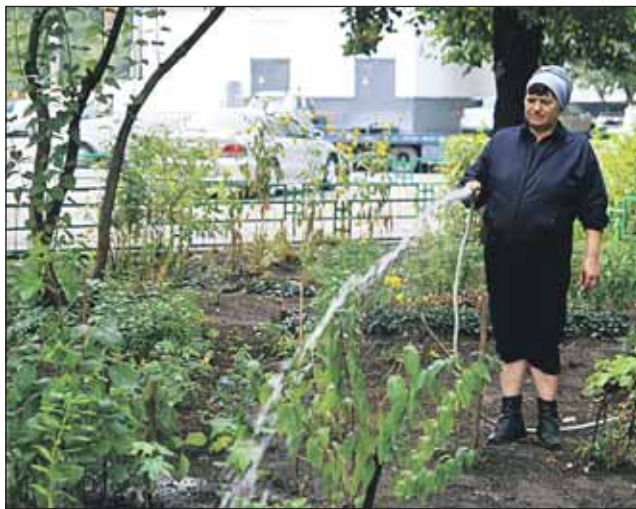
Чтобы не было споров, лучше поставить на кран счётчик

Чтобы избежать спорных ситуаций вокруг пользова-