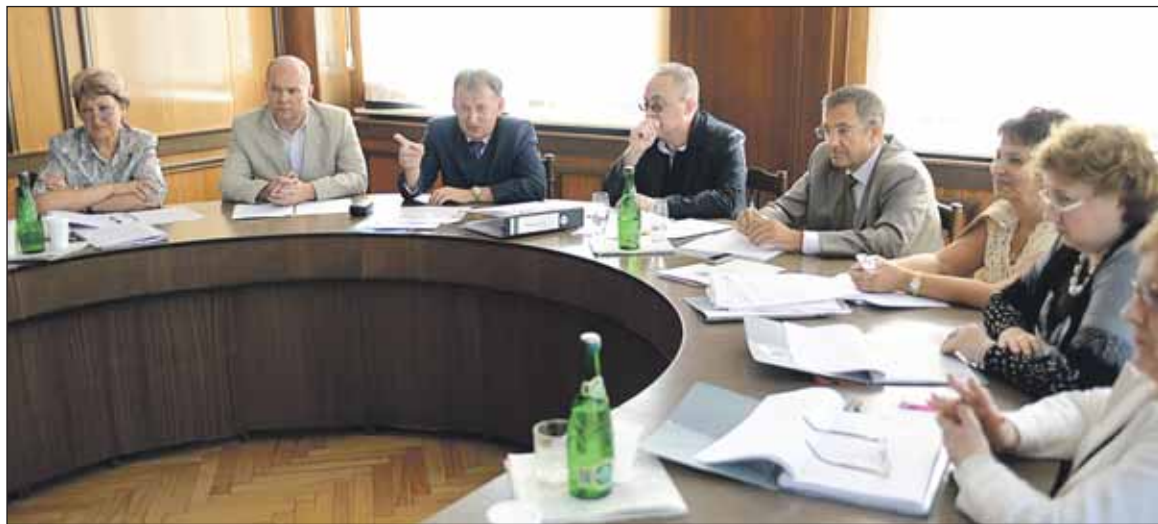
Префект СВАО на заседании муниципального Собрания в Бутырском районе

Благоустройство в районах теперь под колпаком «Муниципального контроля»