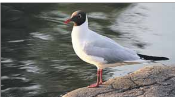
Эта птица где попало жить не станет

Вот уже не первую неделю жители Ярославского района наблюдают необыкновенное явление — настоящее птичье царство на пруду в Лосином Острове. Там, где раньше редко можно было увидеть чайку, теперь целая стая в 30-40 особей с утра до вечера парит над водой.