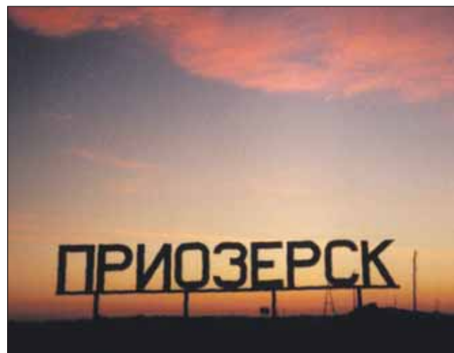
Город Приозёрск находится в пустыне Бетпак-Дала, что значит «голодная степь»