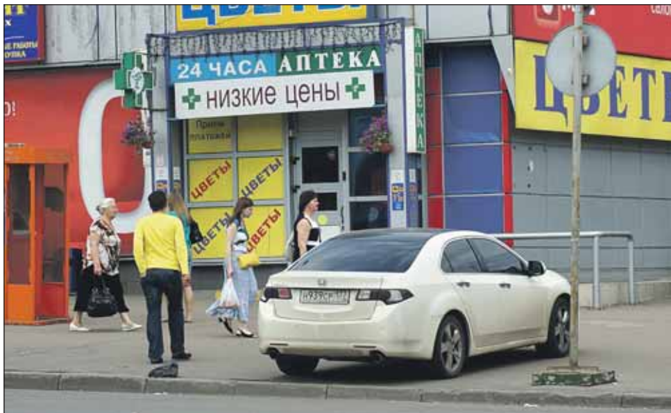
За такую парковку теперь придётся выложить 3 тысячи рублей

Штраф за нарушение правил остановки и стоянки, создавшее препятствие для других транспортных средств, повышается с 300 до 2000 руб. (в городах федерального значения — до 3000 руб.). За прочие нарушения правил парковки (например, под запрещаю-