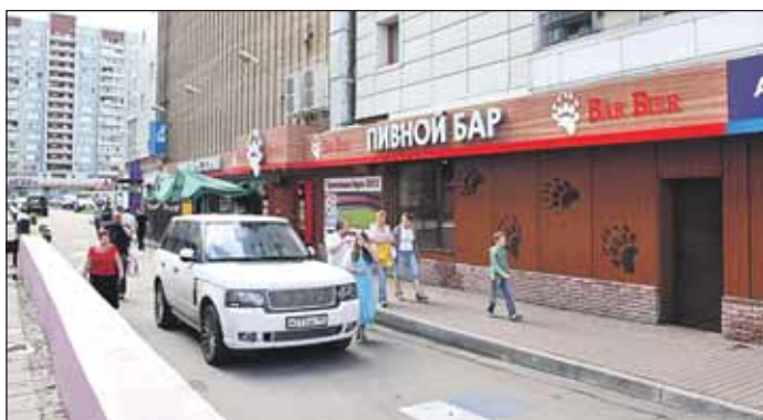
Тот самый бар

Трое вооружённых бандитов в масках влетели в пивной бар на улице Широкой в выходной. Разбив оконное стекло, они под дулами пистолетов уложили на пол посетителя и барменов. Затем один из них встал в дверях, второй держал под прицелом посетителей, а третий, угрожая пистолетом, заставил бармена открыть