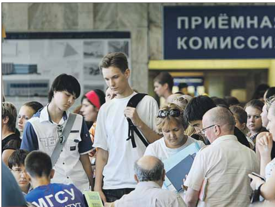
Как и в прошлом году, документы можно подать сразу в пять вузов

Также до конца июля пройдут дополнительные испытания, которые требуются на некоторых факультетах. Обычно это творческие экзамены — например,