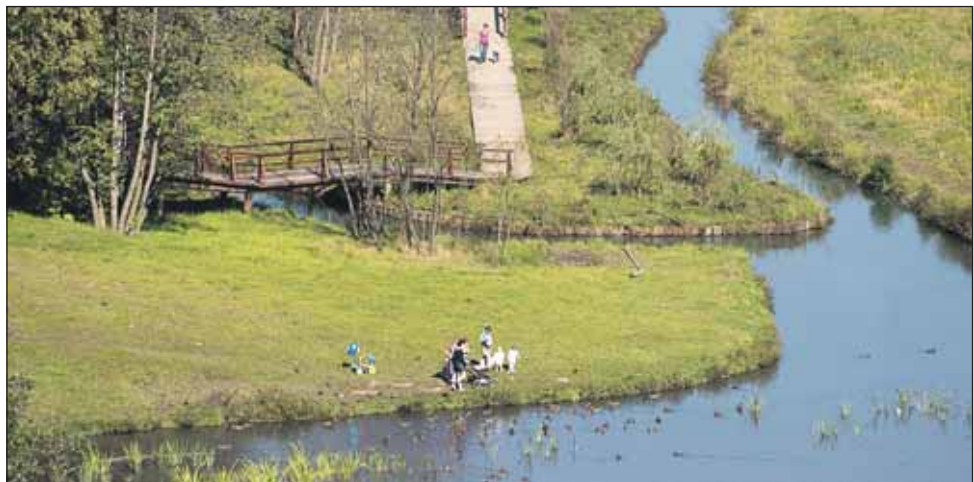
В Алтуфьевском заказнике круглый год живут серые утки