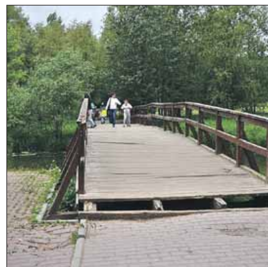
На фото читателя — тот самый сквер