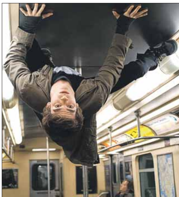
Много трюков Гарфилду пришлось исполнять самому

— А как вы вообще отреагировали на предложение сыграть сверхчелове-