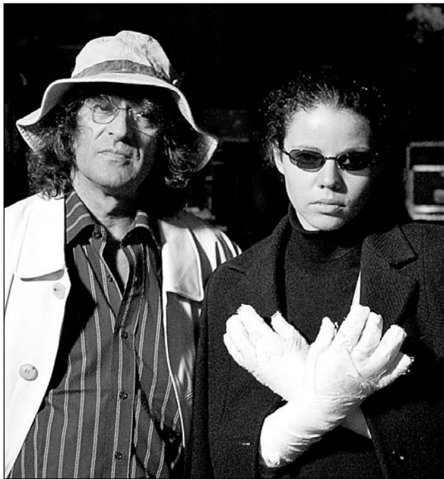
Кадр из фильма «2-АССА-2»

Лицензия № 77-01-0033378 от 29.12.2007 г. по 29.12.2012 г.