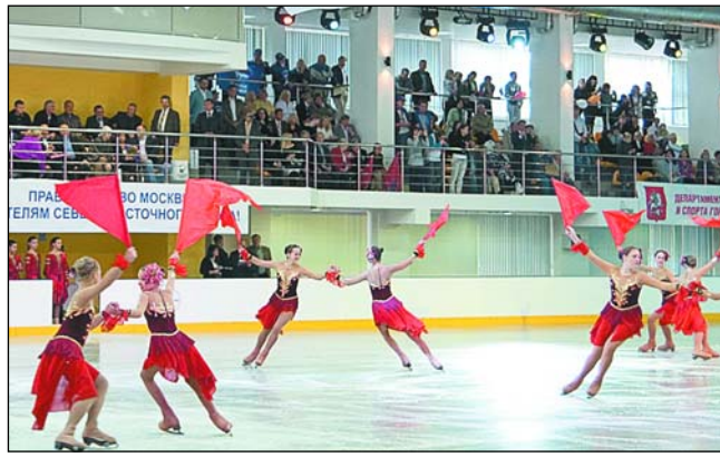
Ледовое шоу будущих звезд