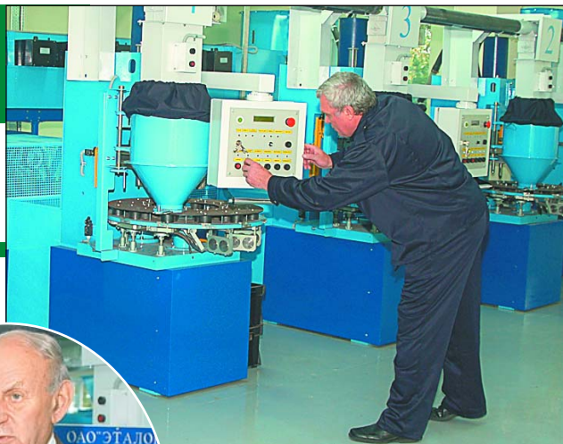
Для обслуживания линии по производству биоконтейнеров много рабочих не нужно