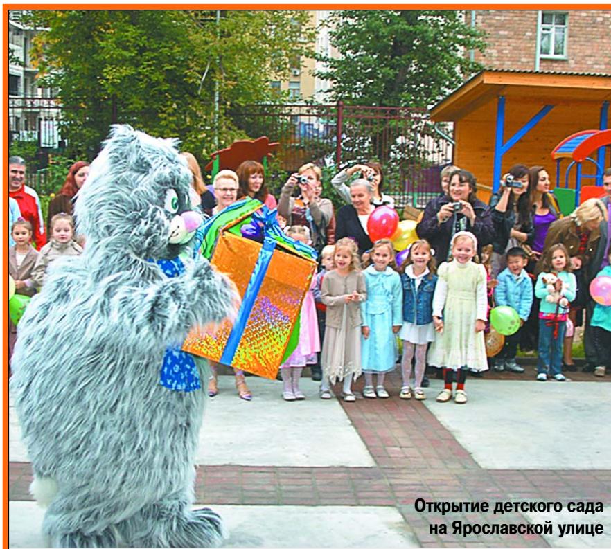
Открытие детского сада на Ярославской улице