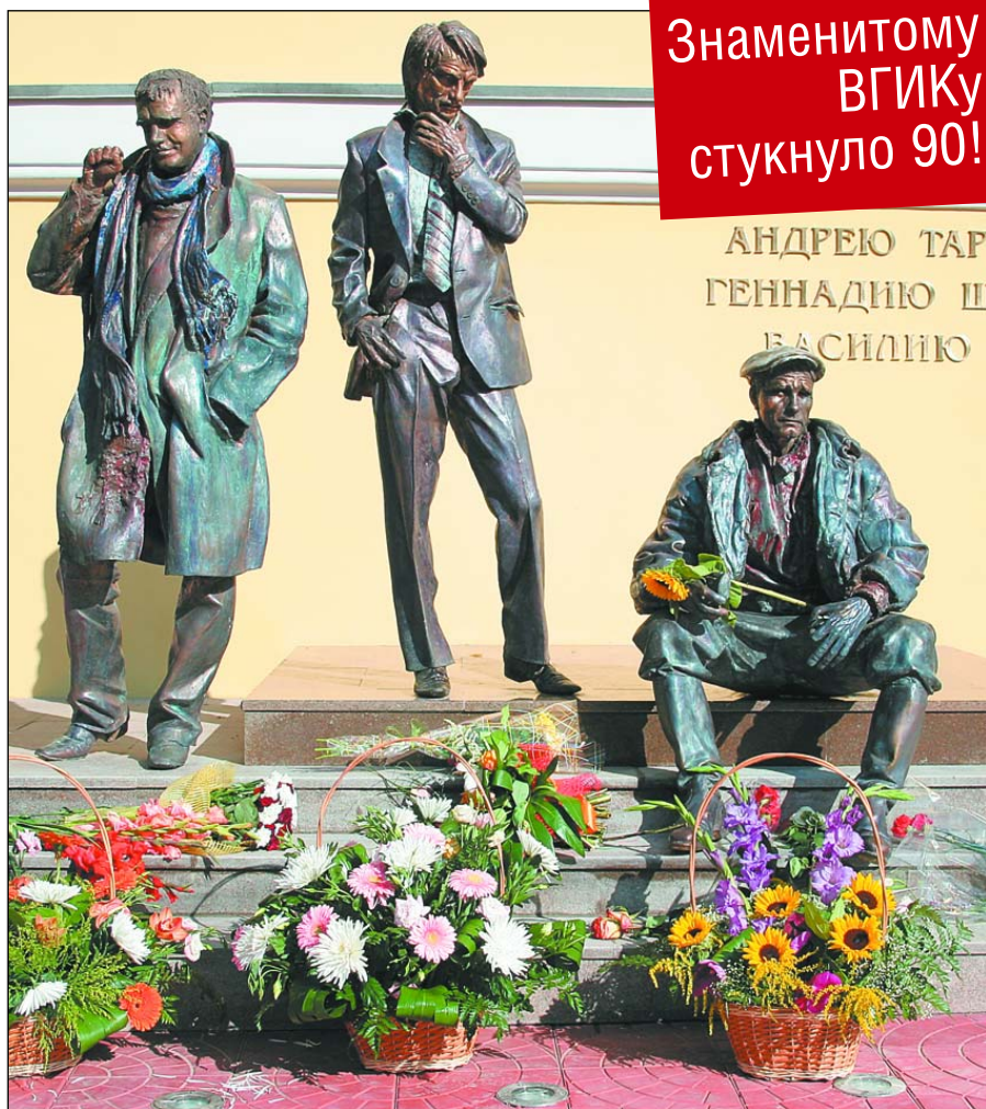
Великая тройка выпускников: Шпаликов, Тарковский, Шукшин

Н едavno на улице Вильгельма Пика в Ростокине у входа во Всероссийский государственный институт кинематографии появилась скульптурная тройца — Шукшин, Тарковский, Шпаликов. Таким оригинальным памятником трем выдающимся вгиковцам знаменитый институт встретил свой 90-летний юбилей.