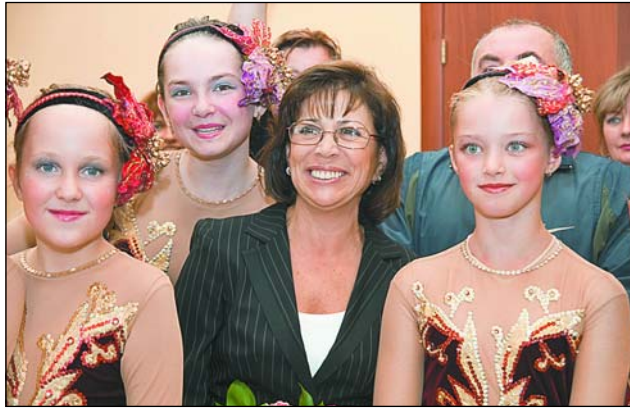
В день своего юбилея на открытие приехала Ирина Роднина