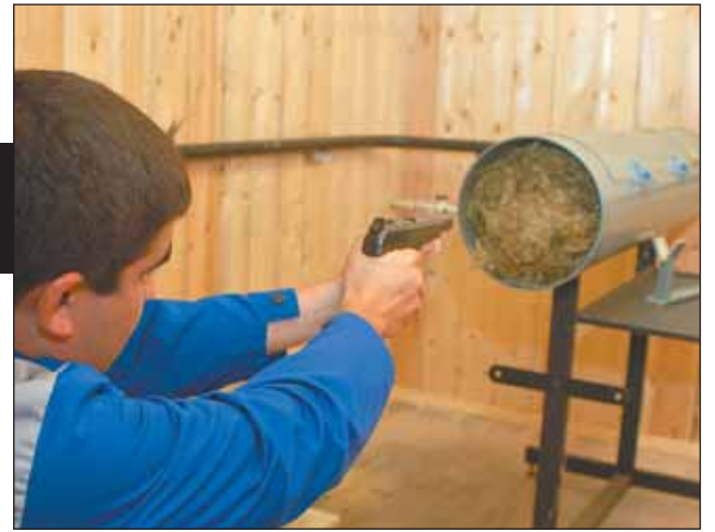
В лаборатории УВД СВАО баллисты чаще всего испытывают пистолет Макарова