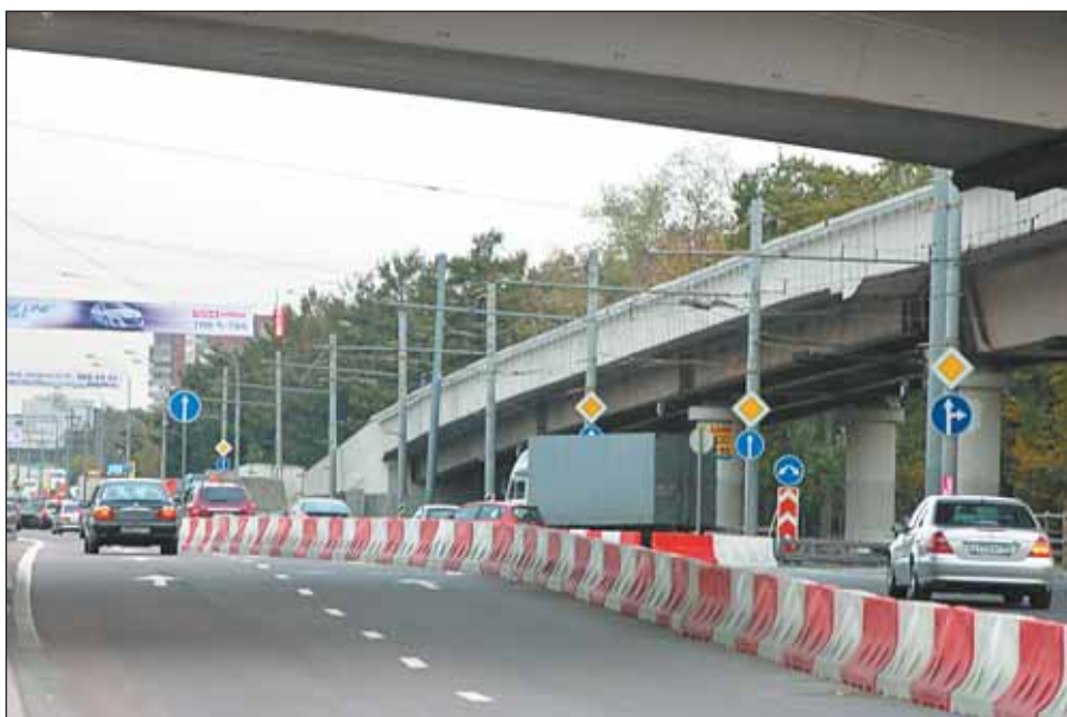
Смысл эксперимента — чтобы водители не прыгали слева направо и справа налево через все полосы