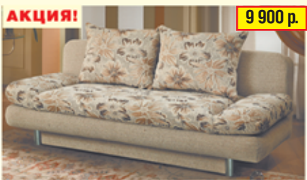
«Фантазия» , тахта с механизмом «еврокнижка», разм. 1920*870*900, с/м 1900*1350