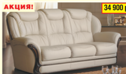
«Мартель» , трехместный диван-кровать, 100% кожа, механизм «Спартак» разм. 1920*1070*940, с/м 1860*1350