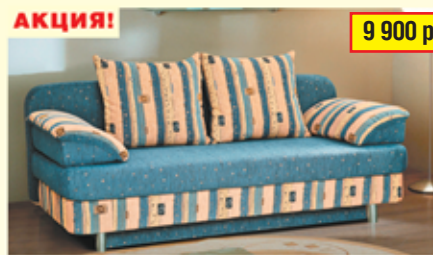
«Олимп-2» , тахта с механизмом «еврокнижка», разм. 1920*870*900, с/м 1900*1350