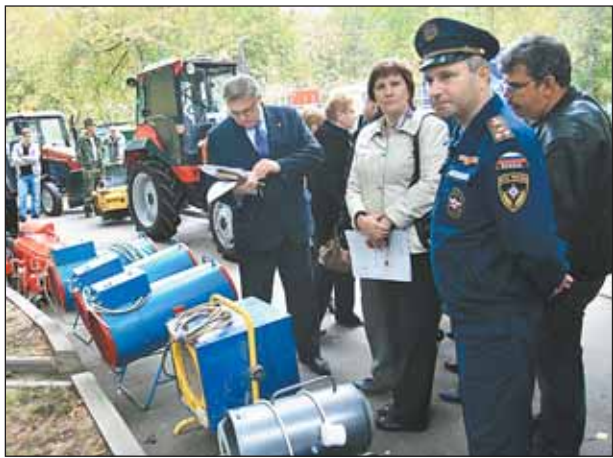
Тепловые пушки готовы «к бою»

С утра пораньше 14 сентября двор у домов 180 и 182 по проспекту Мира (рядом с гостиницей «Космос») заполнился спецтехникой, появились люди в форме МЧС и Мосводоканала, растянули палатку. Местных жителей об учениях известили заранее. Сценарий таков: происходит авария на тепловом пункте (горит трансформатор), семь жилых домов остаются без электричества, воды и тепла. Коммунальщики привезли тепловые пушки — они помогут сохранить тепло в подъездах. На грузовиках в сопровож-