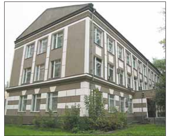
Институт пути — изюминка бывшего города Лосиноостровск