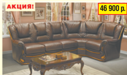
«Изабель-2» , угловой диван, 100% кожа, разм. 2830*960*1770