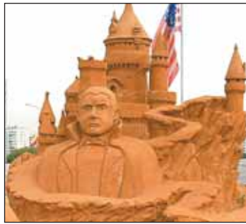
Замок Дракулы (по фильму Ф.Копполы)

До 4 октября в парке «Коломенское» продлится международный фестиваль песчаных скульптур. В нем приняли участие мастера из России, Индии, США, Италии. В этом году фестиваль посвящен шедеврам мирового кино. Художники творили по мотивам картин Альфреда Хичкока, Джеймса Кэмерона, Павла Лунгина — всего представлено 12 работ. Среди них выделяется «Отечественный кинематограф» с персонажами любимых в нашей стране фильмов. Фигуры покрыты клеем, чтобы выдержать непогоду. Открыта здесь и детская площадка, где можно поупражняться в валянии песчаных скульптур.