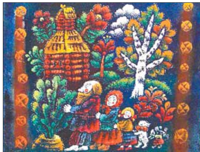
«Репка» Евгения Ревякова

На выставке можно увидеть живопись, графику и сатирические рисунки, опубликованные в журнале «Крокодил». Творчество художника высоко ценят мультимедийный артист и всемирно известный