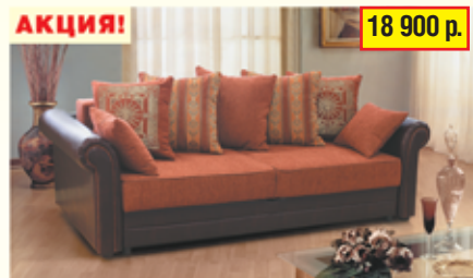
«Софи-2» , трехместный диван-кровать с механизмом «тик-так», разм. 2350*900/750*8950, с/м 1900*1400