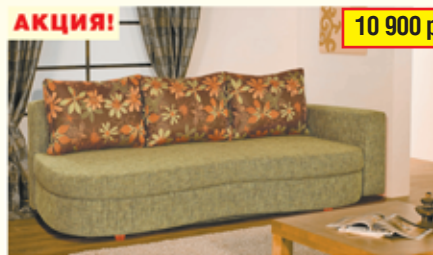
«Диана-3» , тахта с механизмом «еврокнижка», разм. 2250*920*1050, с/м 2050*1450