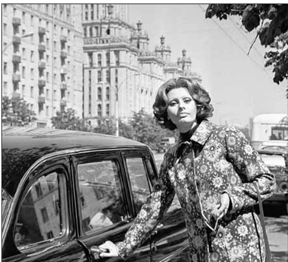
Софи Лорен на Кутузовском. Эпоха Брежнева

До 14 октября в Центре современного искусства «Винзавод» можно увидеть 50 фотографий зарубежных звезд кино и эстрады на выставке «Иностранцы в СССР». Их снимали в Москве, Санкт-Петербурге и других городах фотокоры ТАСС: поп-группа «Бони М», режиссер Федерико Феллини, актеры Ив Монтан и Джульетта Мазина, оперная дива Мария Каллас. Есть и фото Иосипа Броз Тито на отдыхе, президента Франции Шарля де Голля, получившего в