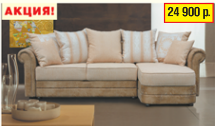
«Софи-2» , угловой диван-кровать с механизмом «тик-так», два ящика для белья, сменный угол разм. 2500*900/750*1620, с/м 2050*1400