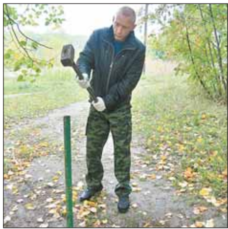
По Студеному проезду в лес уже не въедешь

Столбы заграждения, препятствующие въезду автомобилей в лесопарковую зону, установлены в трех точках СВАО: в районе