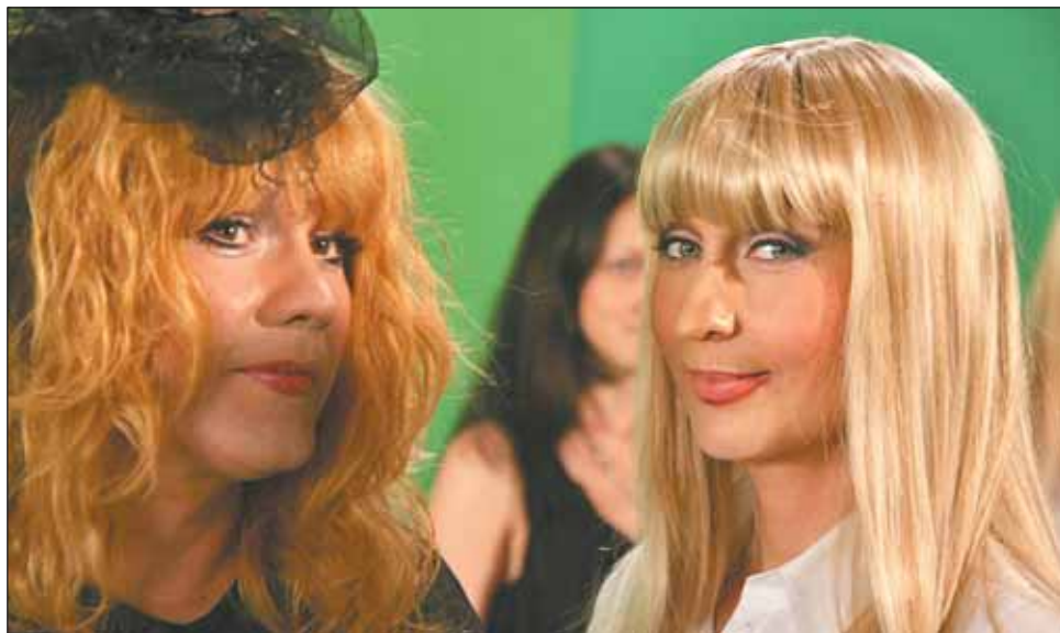
Пародия на Кристину Пугачеву понравилась