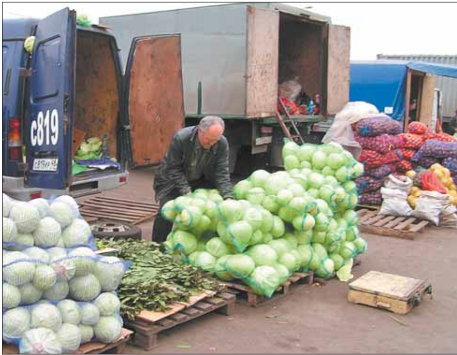
Сбить цены на овощи городские власти пытаются массовыми закупками

операторов ярмарок, резких скачков цен на картофель больше не будет: все возможности для роста ис-