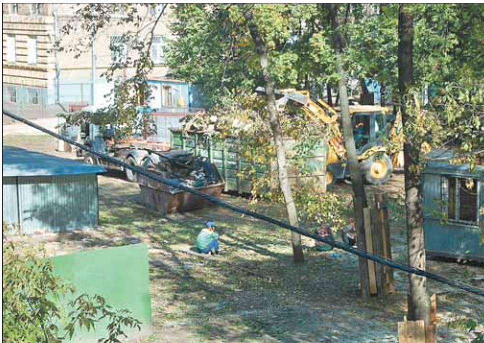
Вот место, о котором идет спор

У программы строительства социально важных объектов есть и противники