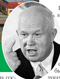
Когда-то на этом месте (улица Пришвина) был образцовый колхоз

кова, лепились нищие домишки. Все колхозное имущество — десяток коровьих скелетов, пара утильных тракторов и сивый мерин председателя. Колхозники лет десять не получали за свои трудодни ни рублем, ни натурой. Кормились только с приусадебных огородов, которые тянулись меж полей пшеницы и ржи — это от нынешнего Алтуфьевского шоссе в сторону МКАД... Возникла мысль: а не использовать ли товарища