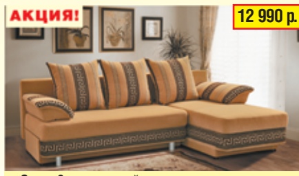
«Олимп-3» , трехместный диван-кровать с механизмом «еврокнижка», два ящика для белья, разм. 2190*790*930*1360, с/м 2190*1320