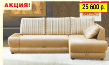
«Капри» , трехместный диван-кровать с механизмом «тик-так», два ящика для белья, разм. 2579*750*980, с/м 2020*1450