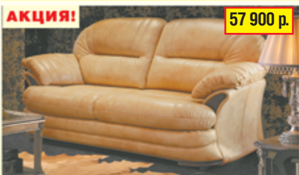
«Йорк» , трехместный диван-кровать, 100% кожа, механизм «Дионис», разм. 2230*1070*1080, с/м 1860*1350

ЛУЧШИЕ БЕЛОРУССКИЕ КУХНИ Большой ассортимент кухонь из пластика, МДФ, массива дуба, ольхи, ясеня, сосны, черешни. Вся мебель произведена по современным технологиям из экологически чистых материалов, оснащена лучшими европейскими механизмами. Кухни по индивидуальным проектам. Цены от производителя.